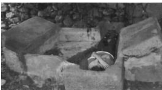
Sartegos medievais procedentes da necrópole de San Martiño.