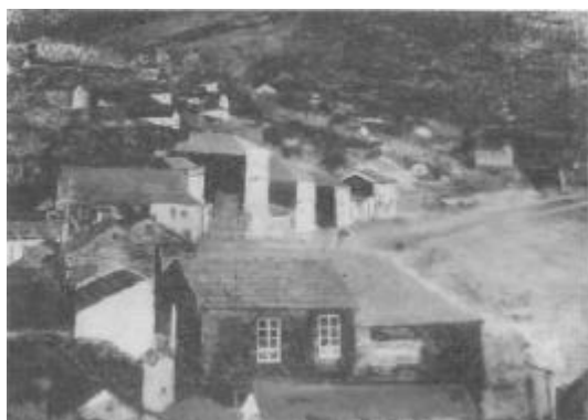
O novo barrio de A Praia, a comezos do século XX. Pintura cedida por un particular.

Un feito excepcional deuse no ano 1877 en que o Concello Constitucional de Moaña, asentado, tres anos atrás, en Quintela decidiu a fundación dun novo barrio, o da Praia, que partía do pequeno núcleo de poboación da Martinga integrado, daquela, en Quintela ao que se xuntou a despoboadá ribeira do mar dos lugares históricos da Miranda e Xeira.