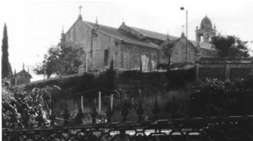
Outarelo pedregoso onde foi erguida a igrexa de San Martiño.

En resumo, o nome dun extenso lugar encharcado ou pedregoso chamada Moaña, xa existía desde o século V ou VI antes de Cristo e os veciños das aldeas que se atopaban na súa contorna constituíron no IX ou X da nosa Era, unha parroquia rural encabezada por unha primitiva igrexa que foi botada abaixo para construír a románica actual, consagrada en 1197.