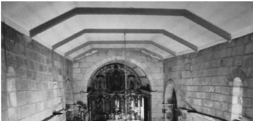
Inadecuada cuberta de formigón na nave románica da igrexa de San Martiño.

Segundo o decreto de división parroquial, asinado en nome do cardeal de Santiago, que seguiu fielmente as instrucións falsas aportadas polo párroco, D. Donato, a parroquia matriz de San Martiño quedaba moi favorecida no reparto de fregueses e barrios. Deste xeito, cumpría con amplitude as normas eclesiásticas; o malo foi que, na realidade, quedouse a segregada do Carme co 70 % dos habitantes e a matriz de San Martiño, unicamente co 30 %; número real de habitantes moi insuficientes para afrontar a conservación dos dous edificios máis emblemáticos de Moaña; o templo románico de San Martiño do século XII e a reitoral do XVI e XVII.