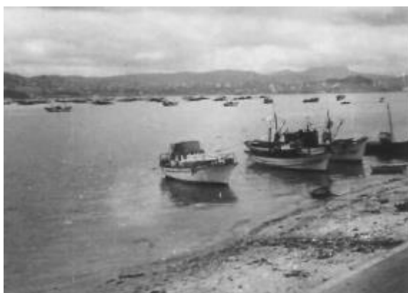
Moto-pesqueiros da ardora varados e fondeados na Praia, nos anos 60.

A partir dos anos 40, ata os 70, do antedito século, na enseada moañesa abundaban os barcos moto-pesqueiros da ardora que daban emprego á meirande parte dos seus homes, conseguindo que Moaña fose unha auténtica potencia en canto á pesca de baixura. Esta situación deu orixe a que se incrementara moito a poboación nos barrios situados a carón do mar, A Praia e Seara.