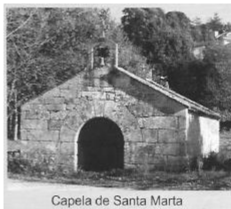
Capela de Santa Marta

Esta capela en estado de ruina foi restaurada a finais do século XX pola Deputación, o Concello e os veciños e foi incluída en 1994 nunha relación de bens provinciais a protexer que non se fixo axeitadamente e contén numerosos erros de catalogación (Ver ficha). Porén, xa hai un tempo, esta capela foi reclamada como Capela de Santa Marta de propiedade particular (de aí o erro máis grave ao non investigar esta circunstancia) e agora o Concello negocia a súa compra para incorporala ao patrimonio municipal.