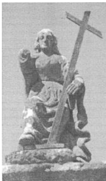
Imagen de la Fe encima del portalón de entrada de la Casa Rectoral de Hío procedente de un antiguo panteón de autor desconocido.