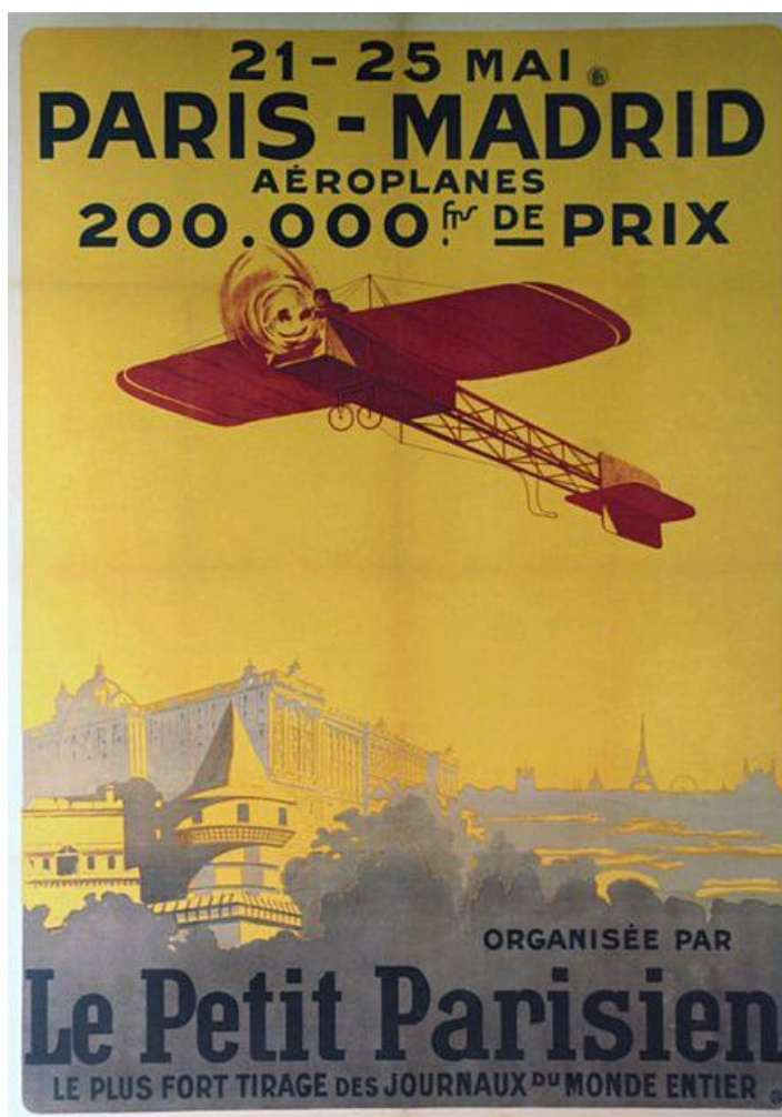
O cartel da carreira por etapas París-Madrid

O comercio estaba pechado por orde da alcaldía a partir das 5 da tarde, para facilitar o achegamento dos veciños e mesmo das xentes que proviñan de lugares tan dispares como Lugo, Ourense, o norte de Portugal, e mesmo de Ribeira, onde fretaron o vapor Farruco, que viña ateigado de xente. A expectación era enorme, indescrrible diríase. Vigo era unha festa. Un par de horas antes do horario previsto, un gran xentío xa cubría o lugar de Balaídos (calculaban que nos dous días de espectáculo puideron pasar polo aeródromo unhas 60.000 persoas), foron numerosos os atascos producidos por automóbiles e mesmo polo propio xentío que trataba de achegarse polas saturadas vías de acceso ó recinto de Balaídos.