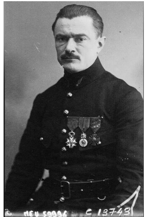
Jules Védrines.

Sabedores os vigueses de que Pontevedra xa tiña o seu cartel de festexos pechado, para non seren menos e evitar quedar descolgados nos circuitos que organizaban este tipo de festivais de voos de acrobacia aeronáutica, quixéronse por á altura de Pontevedra e encargaron para iso á “Asociación Popular Galega”, de Vigo , de atopar uns aviadores á altura das circunstancias. A Asociación contrata para os días 18 e 20 de agosto os experimentados aviadores acróbatas “Elgorry” e “Mauvais”. Mais o infortunio non permitiu que tal demostración puidera levarse a bo termo: Elgorry enfermou e Mauvais quedou ferido nun accidente automobilístico cando circulaba pola Coruña.