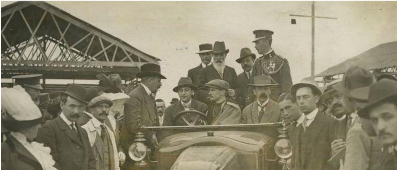
Campo de aviación de Madrid (Xetafe). Védrines, cun cigarro na boca. Recibimento tras gañar a Paris-Madrid.