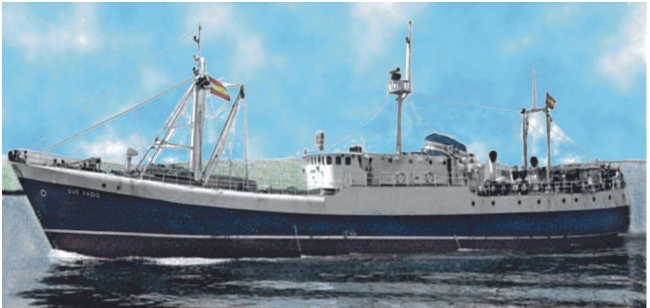
Motopesqueiro "Quo Vadis".