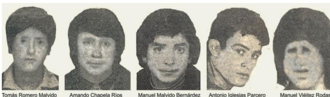
Náufragos do “San Martín” acaecido o 25 de agosto de 1977.