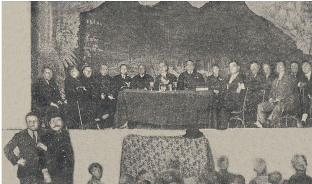
Entrega de pagas de Vejez del Marino no cine de Cangas, 1927.