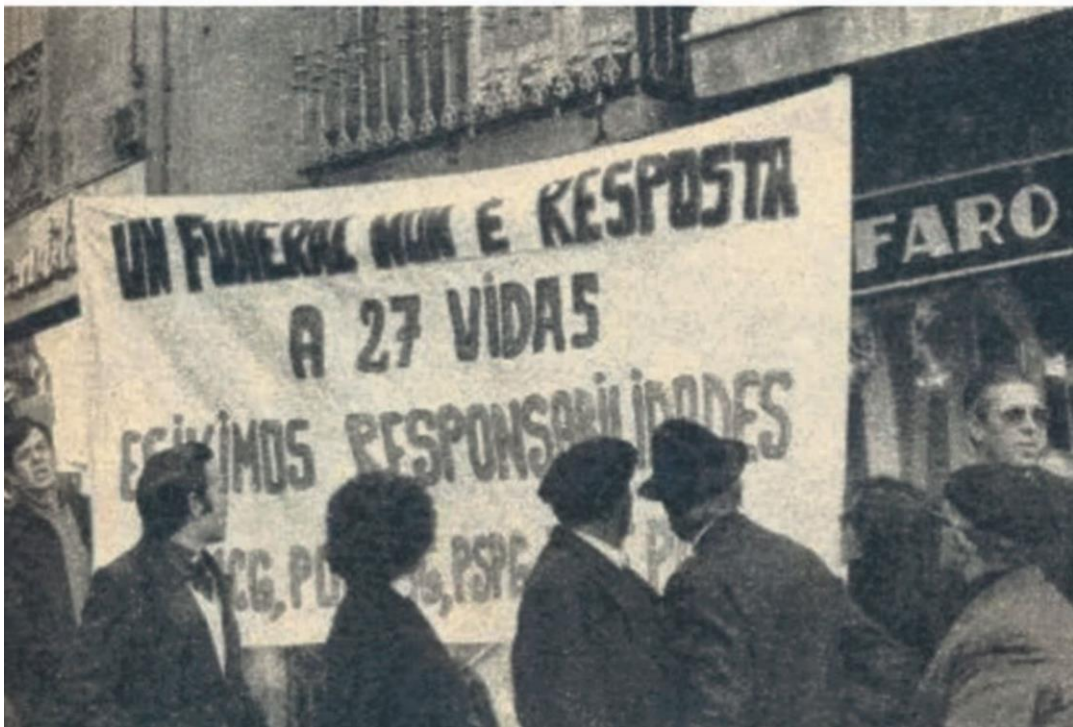
O "Marbel" e protesta en Vigo polo naufraxio.