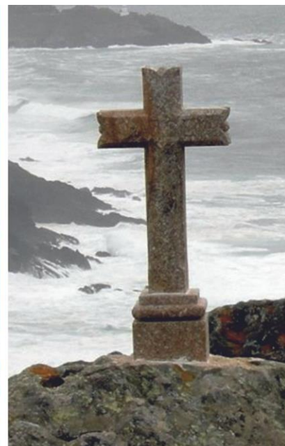
Cruces de Punta Robaleira o do Cabezo que lembran a vítimas do mar na Costa da Vela.