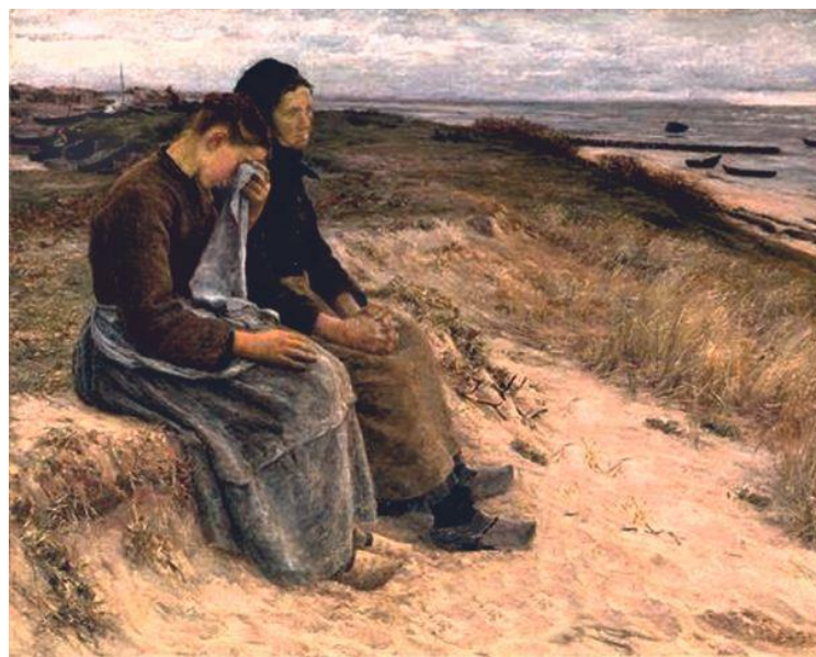
El cuadro "Barco desaparecido" de S. Pinto.