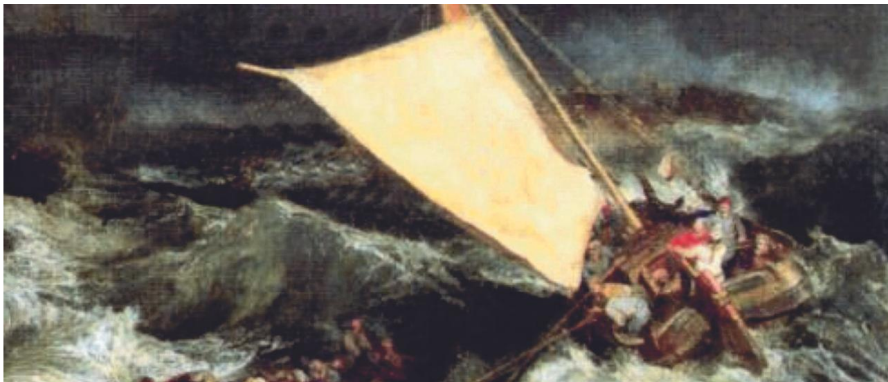
Naufraixio nunha pintura do século XIX.