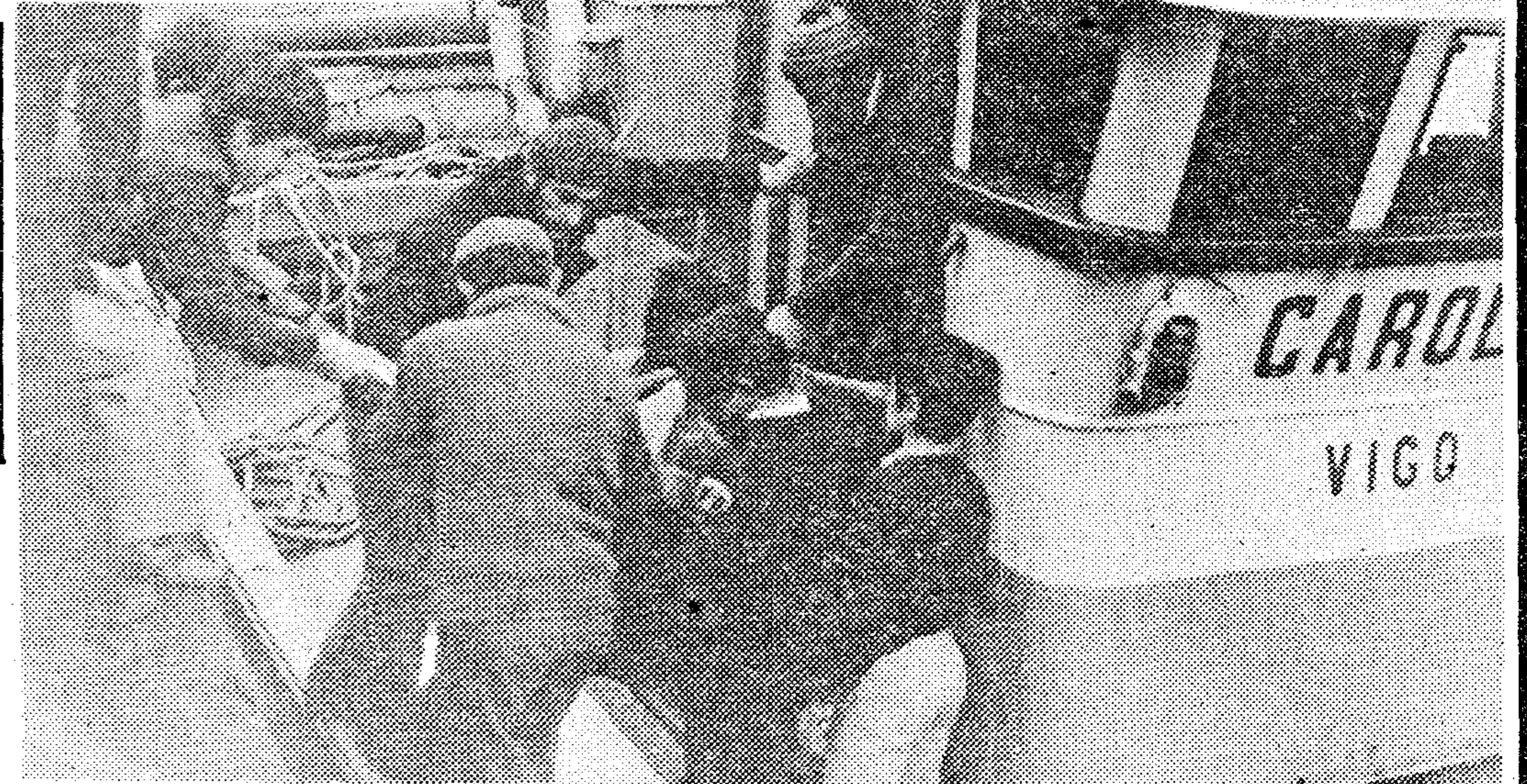
■ La instantánea de Barreiro recoge el momento en que es descendido del buque «Carolo» uno de los supervivientes del naufragio del «Marbel»