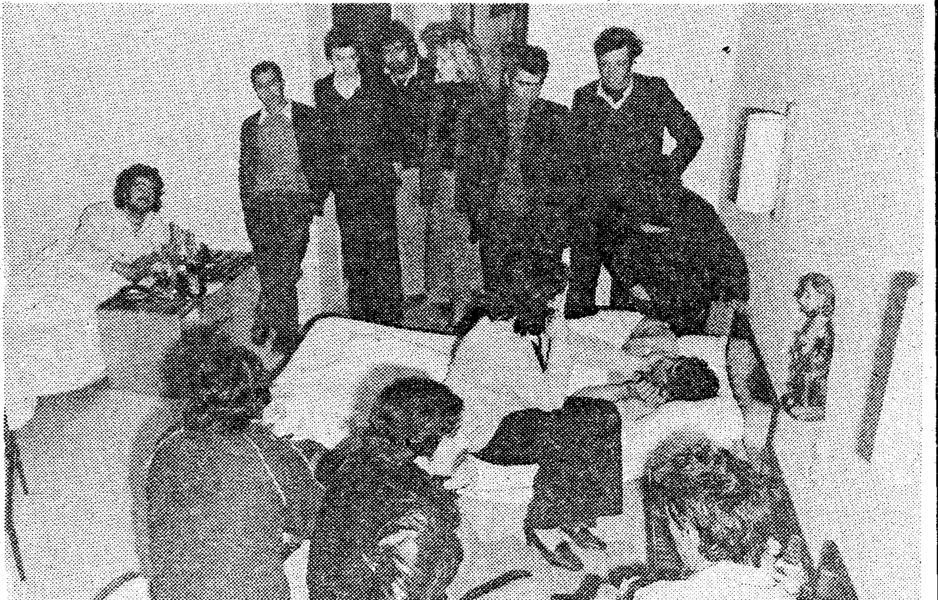
■ La habitación de la Casa del Mar donde fueron llevados los supervivientes presentaba este aspecto a primera hora de la tarde. Familiares y amigos acudieron a saludar a los rescatados con vida