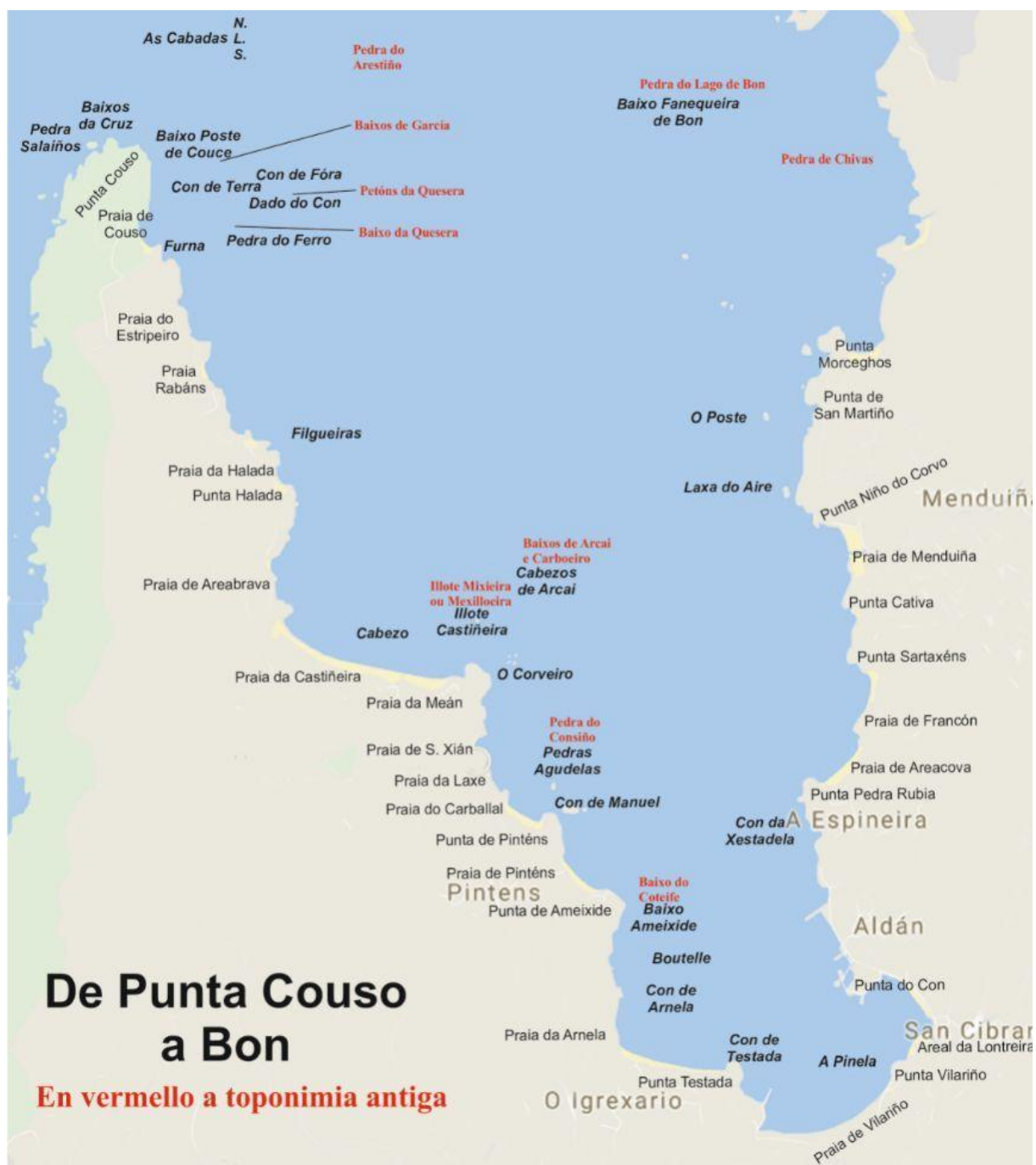
Mapa coa toponimia desde Punta Couso a Bon

Xa perto da costa de Couso temos o Baixo do Poste de Couce, os Baixos de García, o Con de Fôra, o Con de Terra, os Petóns e o Baixo da Quesera, o Dado do Con e a Pedra do Ferro, estes últimos por fronte da Praia e da Furna de Couso. En canto a este último nome, cabe que lle veña a súa designación porque nos antigos balizamentos, algúns puntos perigosos sinalábanse cun ferro chantado nas rochas. A seguir veñen as praias do Estripeiro (arbustos) e de Rabáns e máis adiante as pedras Filgueiras case por fronte da Praia e Punta da Halada que recibe este nome de cando se recollían as redes dos cercos halándoas desde terra. Por fronte da Praia da Castiñeira están, de menor a maior distancia, a rocha do Cabezo, os illotes Mixieira (igual que Muxieira) e Castiñeira, os Baixos de Arcai e Carboeiro e os Cabezos de Arcai que quizáis se refiran a un nome propio (Arcadio?).