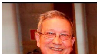
*Profesor e investigador

Na praia e punta de Vilaríño destaca a Pedra da Pinela e a seguir temos o Areal da Lontreira, a Punta do Con, o Porto de Aldán e por fronte da Espiñeira está o Con da Xestadela. A seguir, cara o norte, temos as puntas de Pedra Rubia, Sartaxéns, Cativa e Niño do Corvo e entre elas as praias de Areacova coa Cova da Balea, Francón e Menduiña. Entre as puntas de Niño dos Corvos, San Martiño e Morceghos atópanse as rochas da Laxa do Aire e O Poste e máis arriba xa na zona de Bon (Bueu) están a Pedra das Chivas, o Baixo da Fanequeira e a Pedra do Lago de Bon.