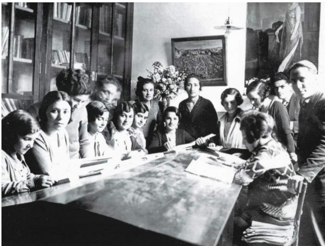
Imaxe da antiga biblioteca popular de Bueu, ubicada nos baixos do actual Concello.

limitaciones necesarias para hacerla compatible con el servicio fijo de la Biblioteca y para impedir que los libros sufran extravío o deterioro anormal, al utilizarse en el domicilio de los lectores...”