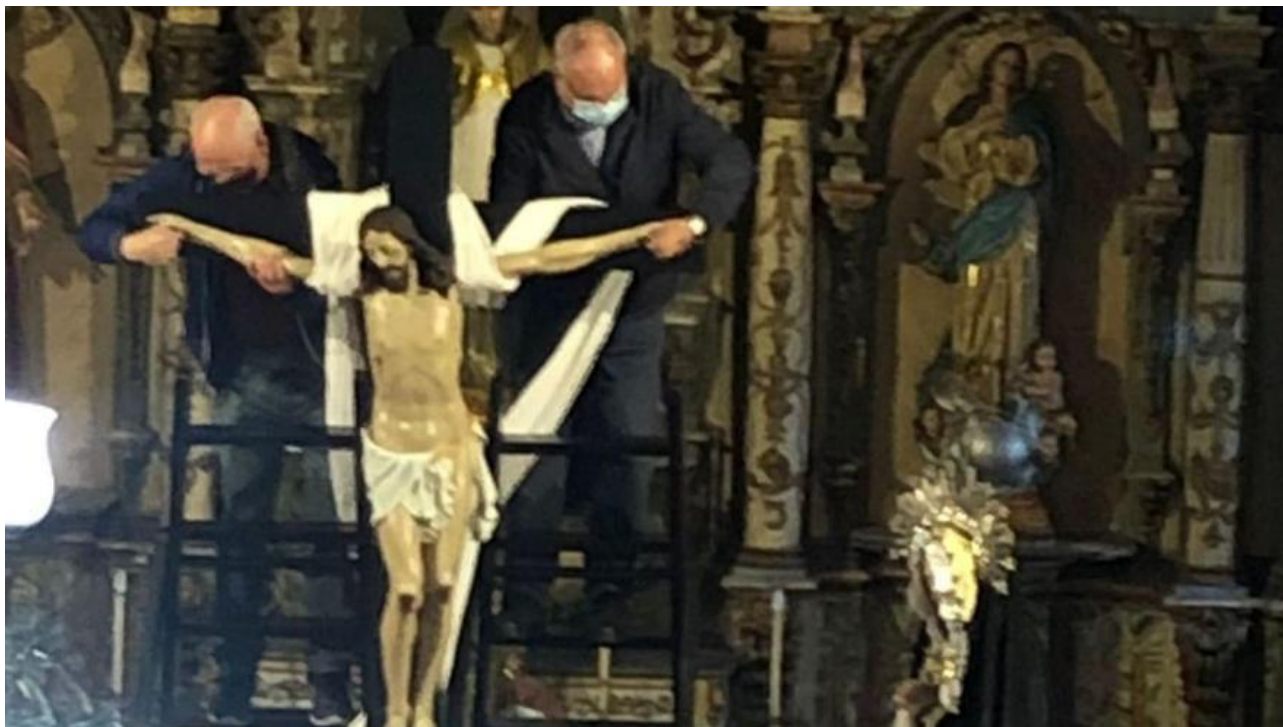
Un momento dunha edición anterior do Santo Enterro.

Celébrase mañá ás 20.00 horas / Por vez primeira, distribúense carteis para dar a coñecer esta tradición