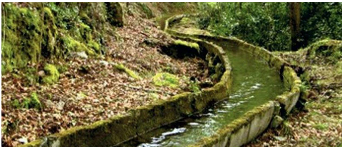
Unha levada de auga para as regas. | A.A.