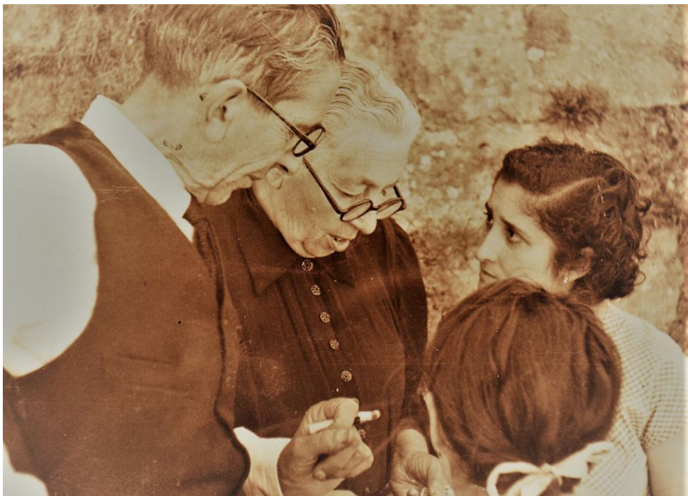
Coa muller e dúas das netas.

Ten realizado numerosos retratos de importantes cargos da vida política e social de Cangas. Fotografou tamén os acontecementos máis importantes ocorridos na vila que publicou na revista Vida Gallega e no xornal El Pueblo Gallego. No 1929 participa como socio fundador do Alondras Club de Fútbol.