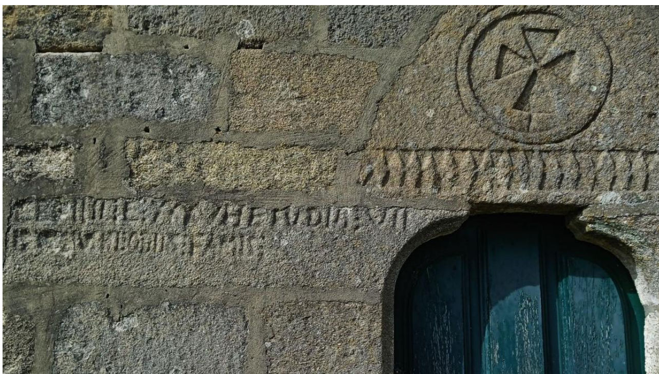
Inscrición fundacional a carón da portal meridional, na actualidade.

https://www.farodevigo.es/o-morrazo/2023/06/04/peligr-inscripcion-fundacional-san-martino-88275010.html