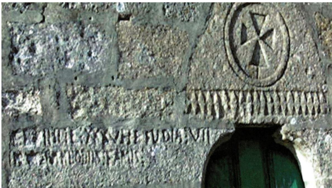
A inscrición no 2016 cando foi transcrita.