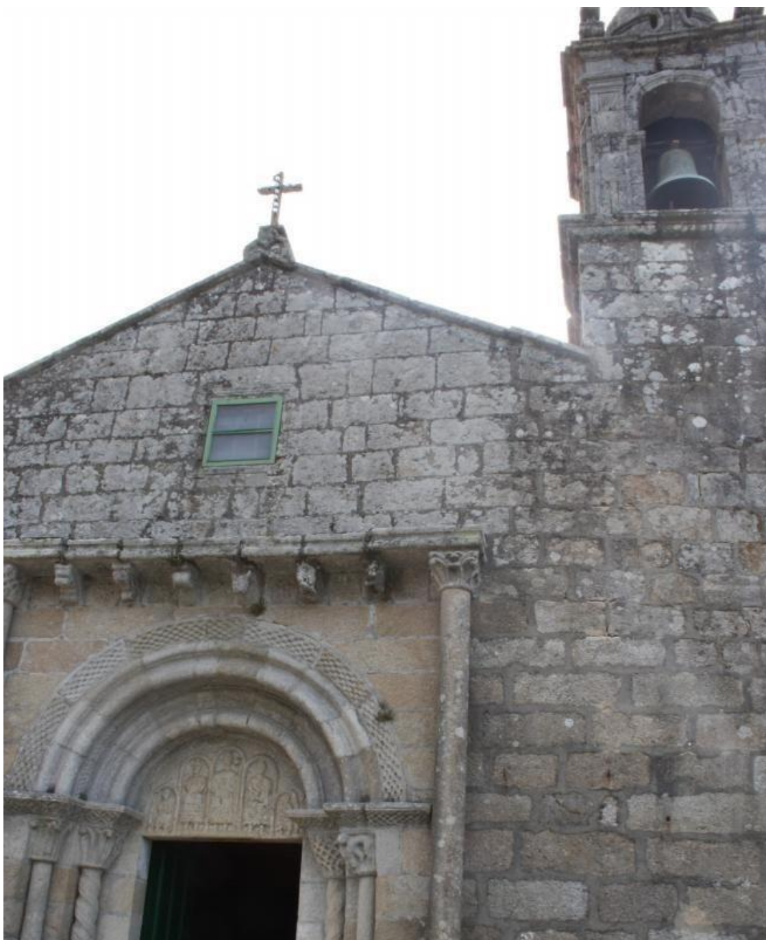
Lugar que ocupou a antiga espadana no cumio da fachada, con pedra de cor diferente. | MANUEL UXÍO.

Dende alí, saían e espallábanse polas 29 aldeas moañesas os sons das campás , que regulaban a vida social da poboación, tanto na súa variante relixiosa como civil; pois, ata que se creou o actual concello, no século XIX, o abade era a máxima autoridade da freguesía.