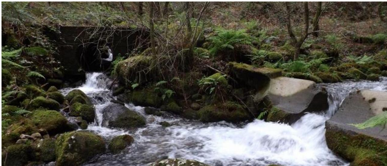
Confluencia do río Maceira co río da Fraga, en Moaña. | MANUEL UXÍO

No ano 1876 constrúese na ribeira deste río moañés, que conta con varios muíños, a única máquina deste tipo para traballar tecidos en toda a comarca