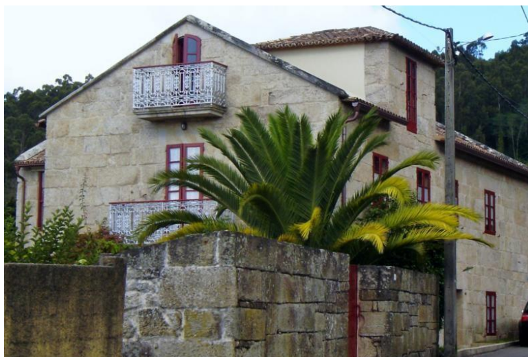
Casa das Señoritas no centro histórico de Moaña.