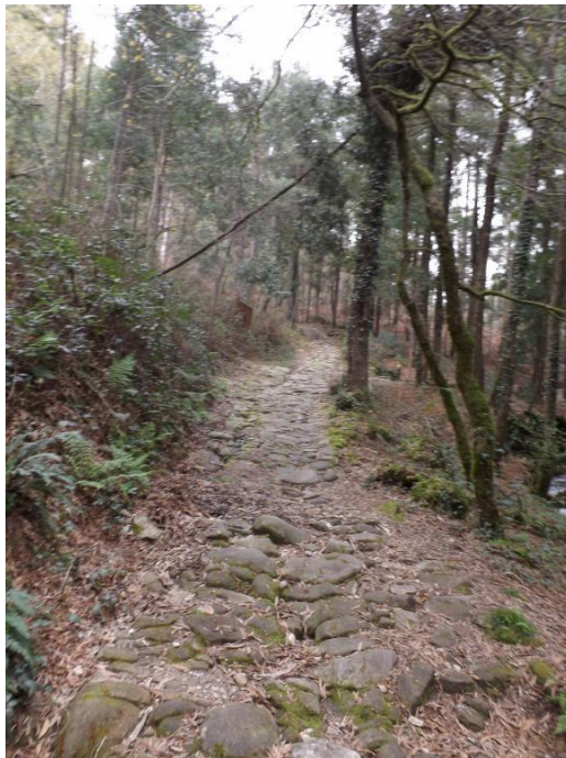
Camiño empedrado de carros que comunicaba co batán e coa zona do Beque.