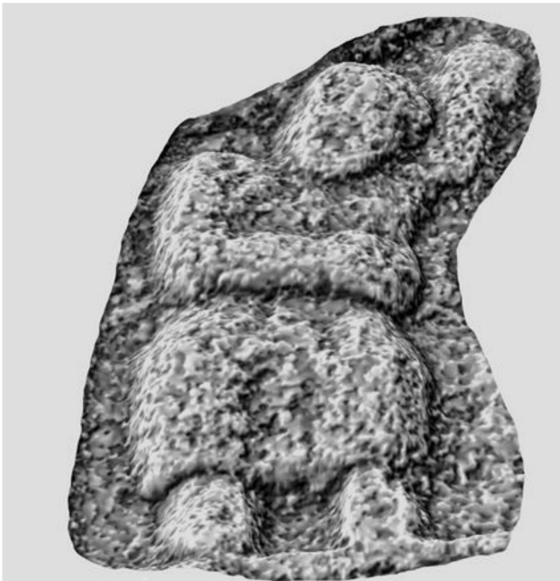
Unha das figuras pequenas do tímpano.

Nos vértices inferiores do tímpano dúas pequenas figuras, probablemente xacentes, pois non debemos esquecer que o tímpano esta feito para contemplar desde un punto de vista baixo e non frontal como na súa representación gráfica.