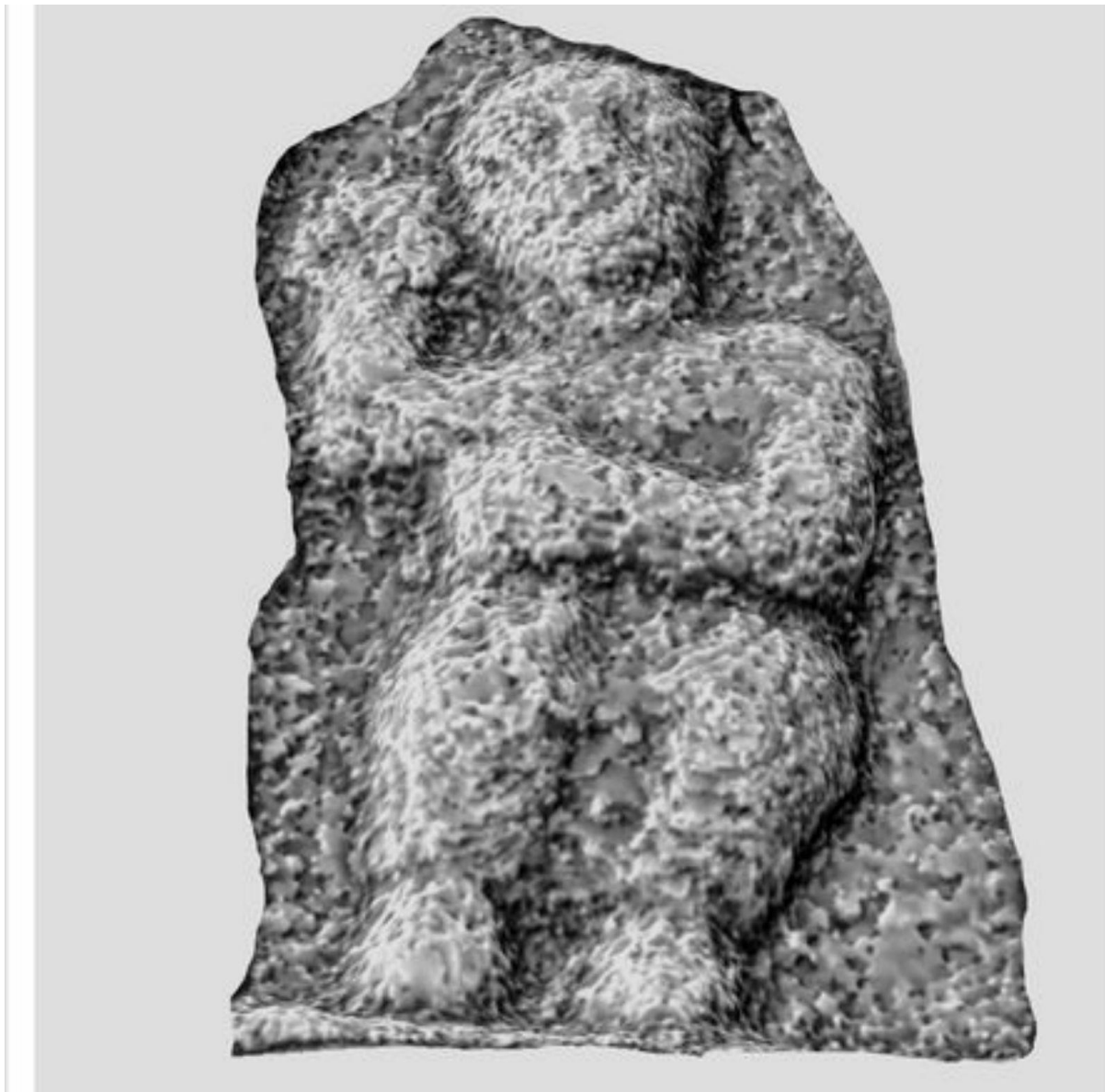
A outra das figuras pequenas do tímpano que o autor identifica como Fernando II.

Estas posturas son semellantes as que amosan os sepulcros de Fernando II, Afonso VIII ou Raimundo de Borgoña no Panteón dos reis de Galicia na Catedral de Compostela pero condicionadas pola limitación do espazo dispoñible. A súa actitude é durminte como acontece cos outros sepulcros cos que comparte espazo. O rei durme agardando a volta a vida, aspecto este que se reflicte no pensamento medieval.