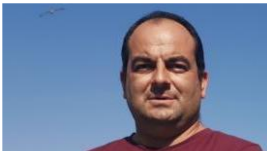
*Veciño do Hío

Fontes consultadas: Galiciana,Familysearch.org, Arquivo Diocesano de Santiago, Arquivo Diocesano de Tui, Arquivo da Deputación de Pontevedra, Arquivo Parroquial do Hío, Arquivo Histórico Provincial de Pontevedra.