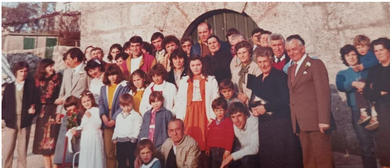
Imaxe dunha voda celebrada na capela de Vilariño na década de 1980.

A xenealoxía, fundación, vinculación, dotación e padroádego da capela da aldea mariñeira de Vilariño