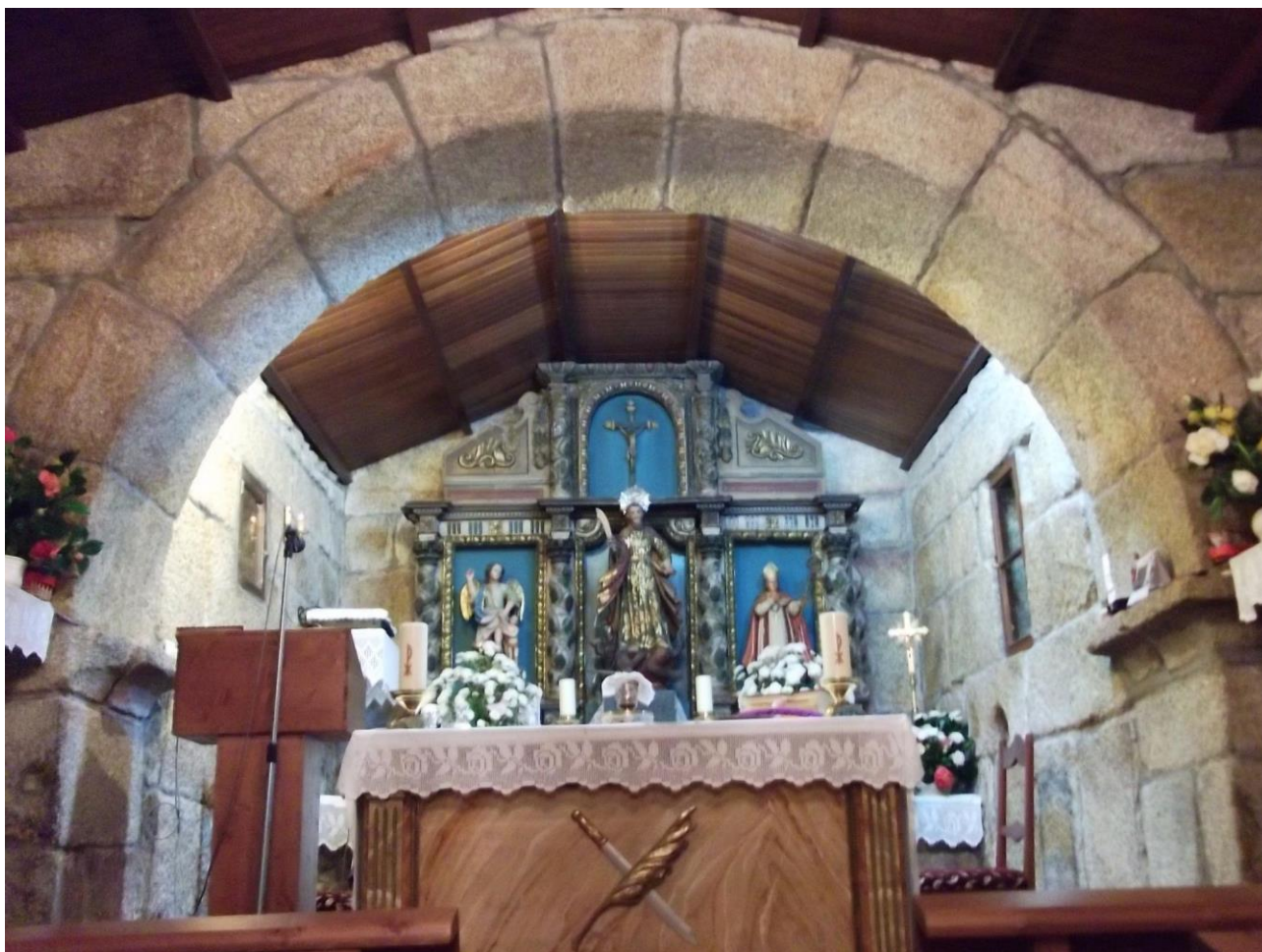
Interior da ermida de San Bartolomé, en Vilariño.