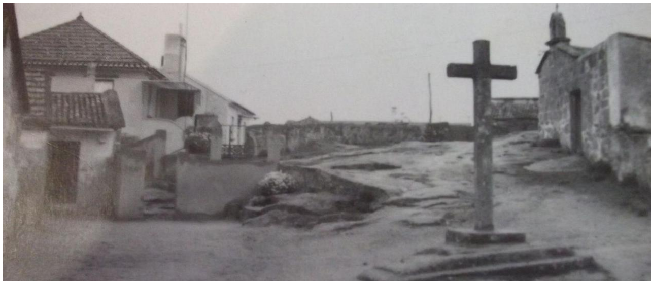
Unha imaxe antiga do entorno da capela de San Bartolomé, na aldea de Vilariño.

No ultimo terzo do século XVII a capela atópase en mal estado polo incumprimento de obrigas por parte dos sucesores de Juan Lavado