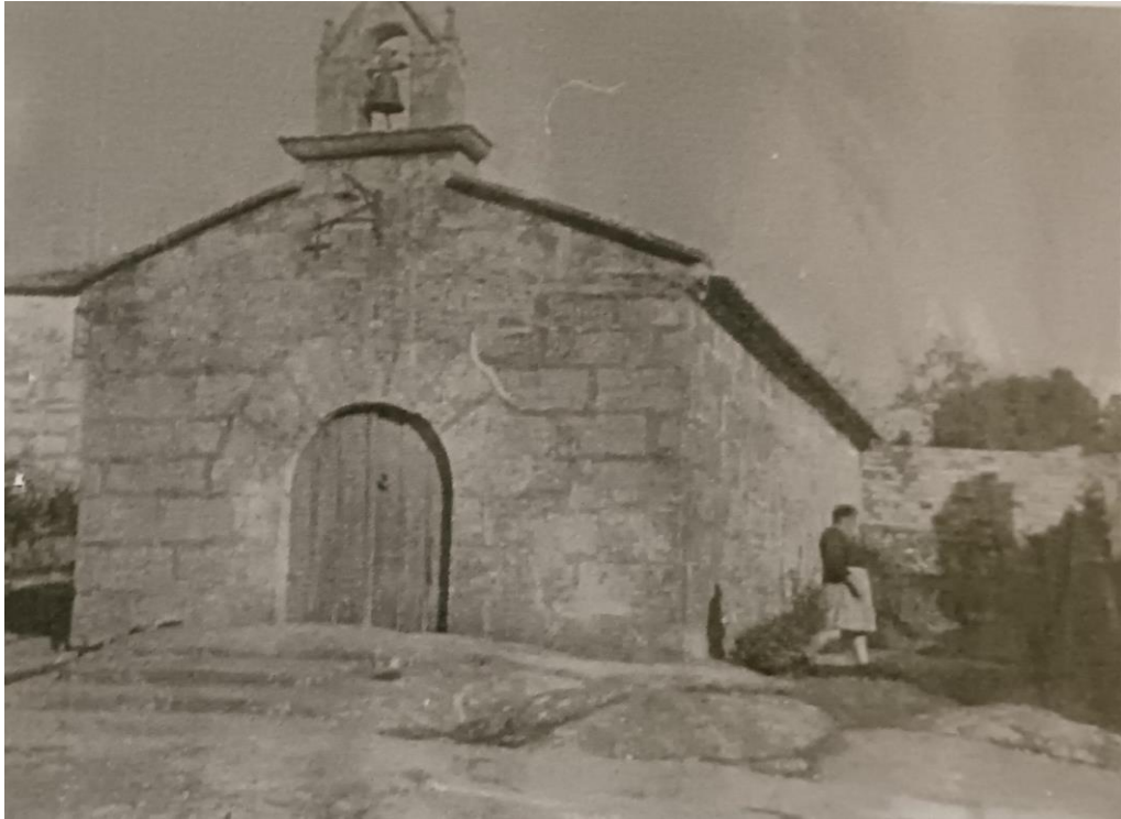
Unha imaxe antiga da ermida de San Bartolomé e o seu adro, en Vilariño.

Algunhas das vivendas que hoxe se coñecen en Vilariño como As Cortiñas deben ser primixenias na relación de Juan e Aldonça co casal de Vilariño. É dicir, que estas construcións contan con máis de catro séculos. Entre os bens da capela aparece descrita un formal de casa media asolagada pola area: "...Una casa que está Cubierta de arena que no vive en ella ninguna pna. (persona) ... /" .