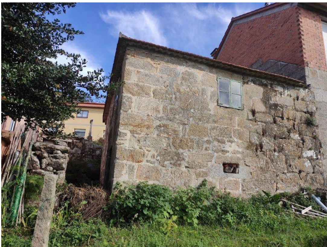
A casa de dos fundadores da ermida, edificada no ano 1601.