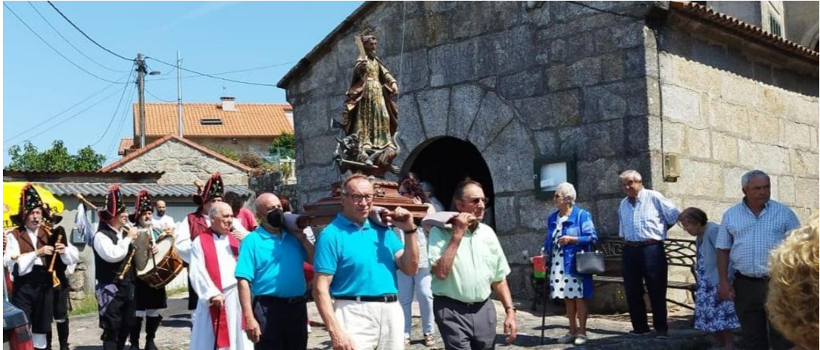
Unha procesión de San Bartolomeu diante da ermida da aldea de Vilariño, no Hío.

Xenealoxía, fundación, dotación, vínculo e padroádego da ermida