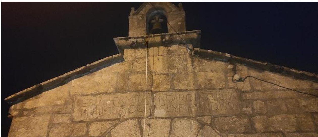
Fachada da ermida de San Bartolomé de Vilariño coa súa inscrición. Anxo Coya

O templo, dedicado a advocación de San Bartolomé, foi mandado construír en 1593 e cumpre agora 430 anos