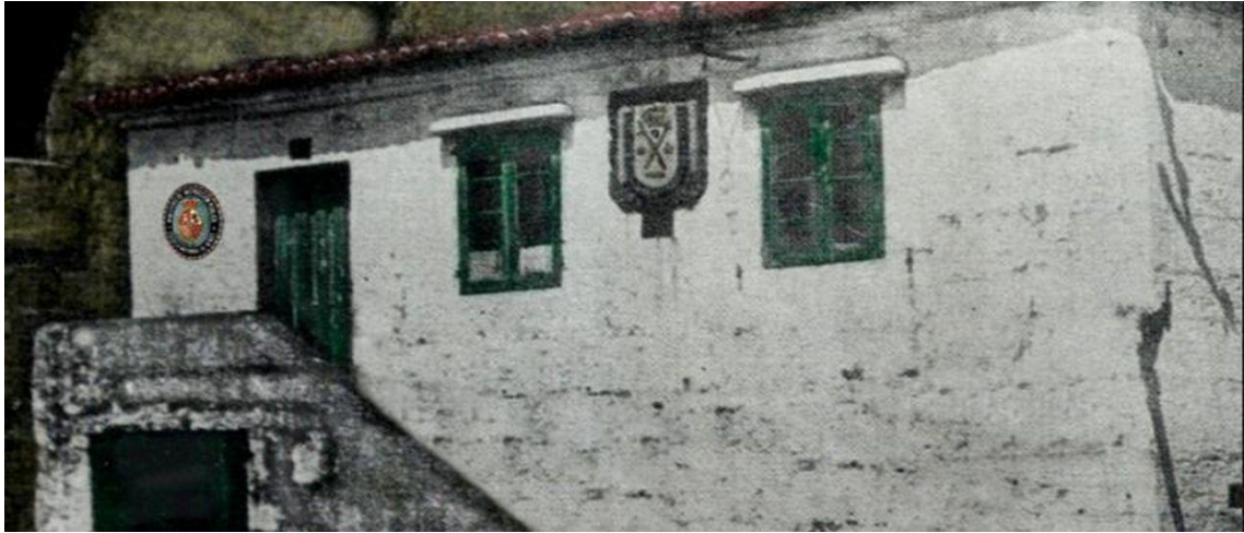
Escola nº 1 de nenos de Cangas, compartida co concello. Permanecería neste local case un século.

O autor percorre os inicios dos centros de ensino da vila dende os datos do catastro de mediados do século XVIII