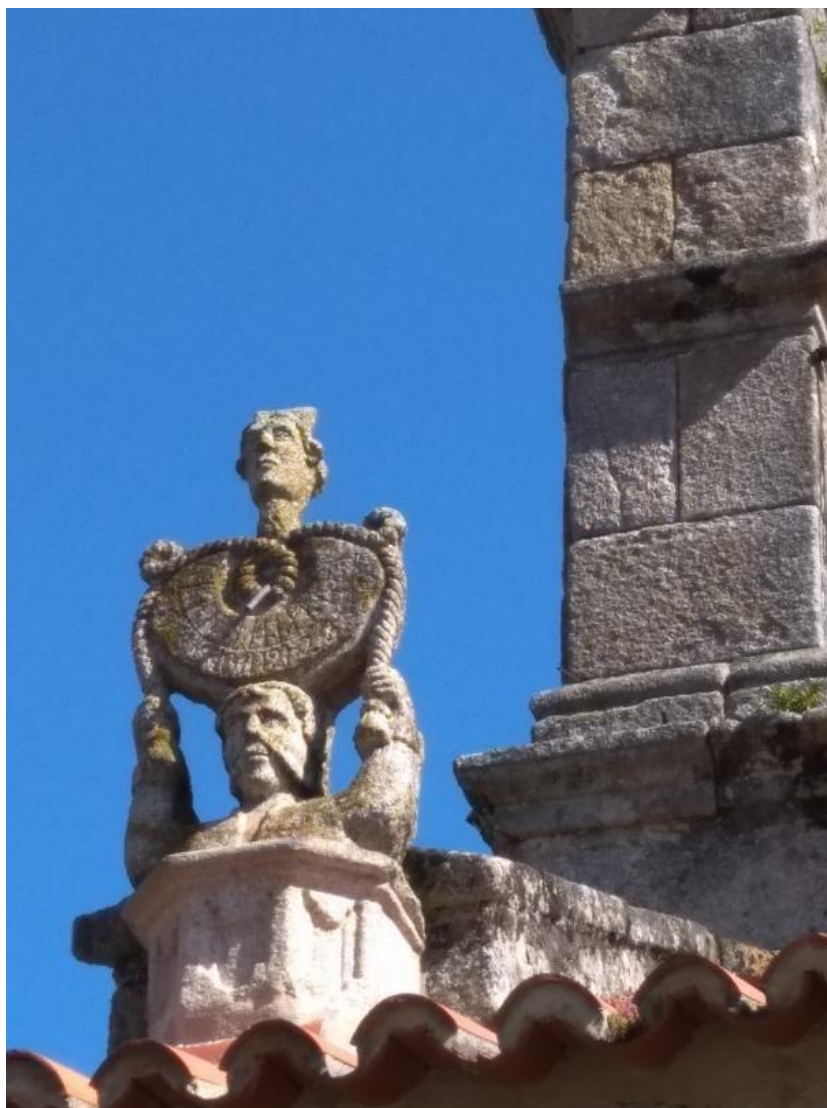
O reloxo de sol na actualidade, na igrexa do Hío. | A.C.