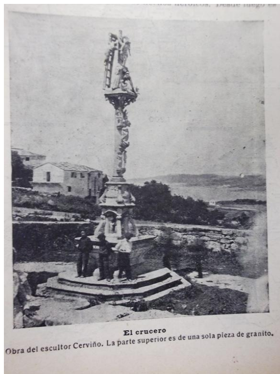
O Cruceiro do Hío, nunha imaxe do ano 1909.