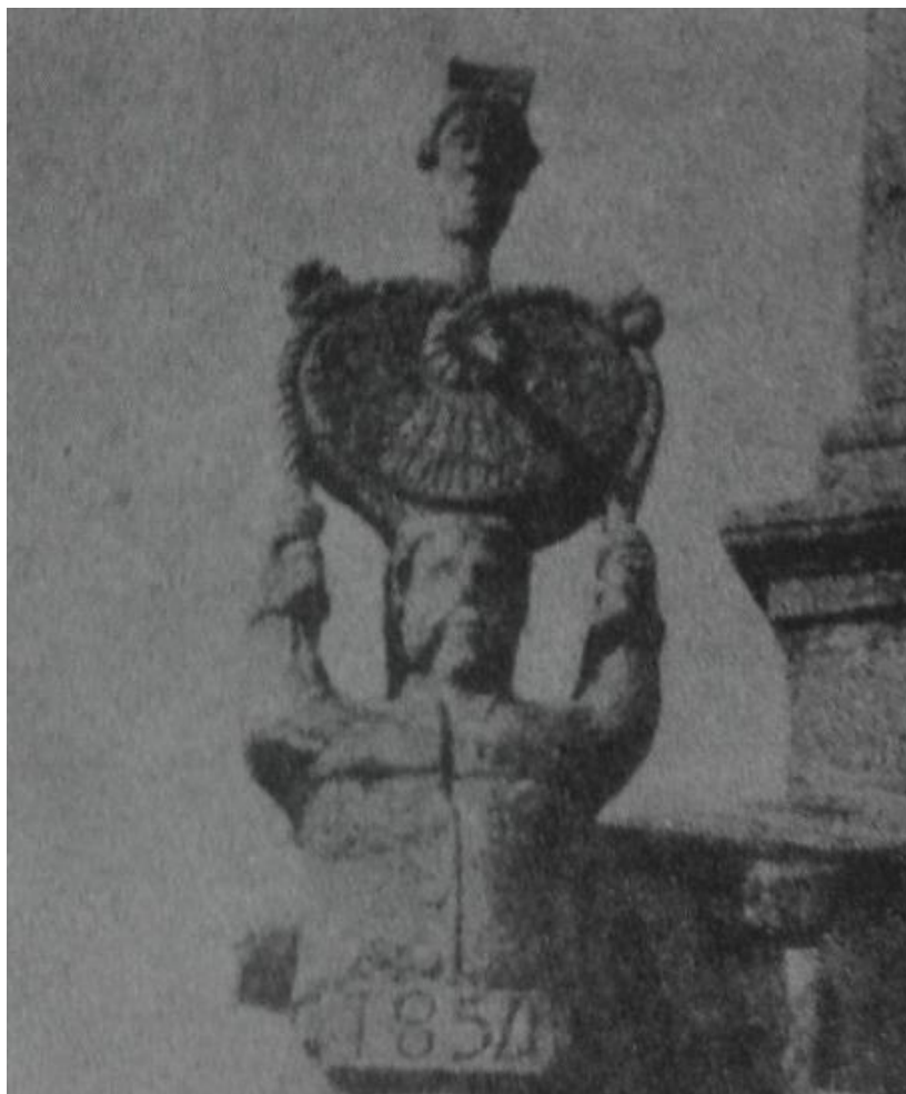
Unha imaxe do reloxo na que se aprecia a data 1854. |