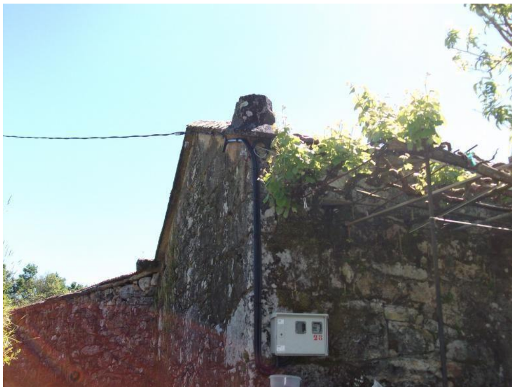
Base da Casa do Casal na que estaba o reloxo de sol. | A.C.

É tradición que o Mestre Cerviño foi o artífice do Cruceiro do Hío e nalgún momento do pasado identificouse co mestre canteiro José Cerviño García ( A Pena, Aguasantas, Cerdedo/Cotobade, 23/05/1843 – 04/01/1922), que neste ano cumpre un século do seu pasamento e que foi recoñecido popularmente como Pepe da Pena. Mais, ata o día de hoxe, non está documentado que este mestre canteiro estivese na parroquia do Hío e tampouco en Pontearreas, concello onde o legado do Mestre Cerviño amósase con grande interese e valor artístico.