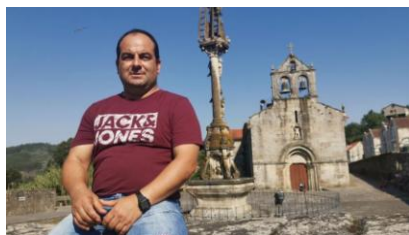
O mestre Cerviño entre nós (I)

Outros informantes aseguran que o acto que se ía celebrar era unha actividade evanxelizadora dos misioneiros (coñecida como misión ). Dunha ou doutra maneira a información oral coincide coa colocación dunha coroa floral que penduraba dende a balconada da casa que se atopa pola parte sur do adro ata o citado reloxo. Dise que ao pasar o auto co material cinematográfico este enganchou no arame ou corda que estaba amarrada aos dos dous extremos, cedendo así o reloxo por ser máis débil. A caída da escultura feriu a unha veciña de Nerga. A peza onde se atopaba gravado o ano de 1854, debeu quedar feita anacos e non se conservou. Un reloxo semellante existía en Cotobade, atendendo a testemuñas orais , e que remataba a cornixa que dá máis ao sur da vertente do cumo da Casa do Casal de Peroselo onde naceu e viviu Ignacio Cerviño. Alí aínda se atopa unha base onde estaría o reloxo.