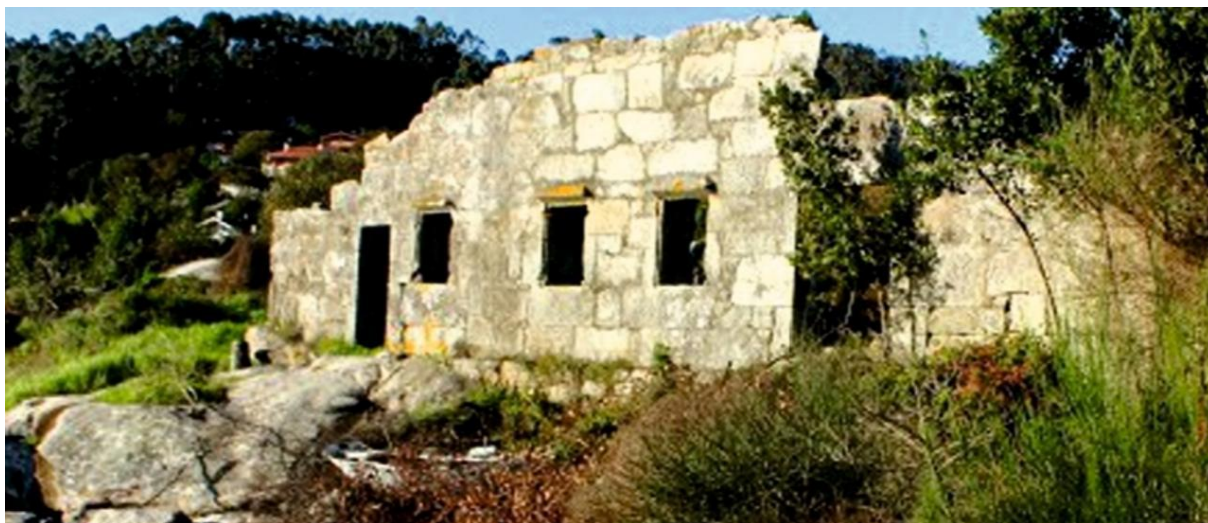
A fábrica de Punta Halada, en Vilanova, na súa denominación orixinal e que provén de "halar" as redes.

Terceira fase do asentamento catalán e chegada a Cangas