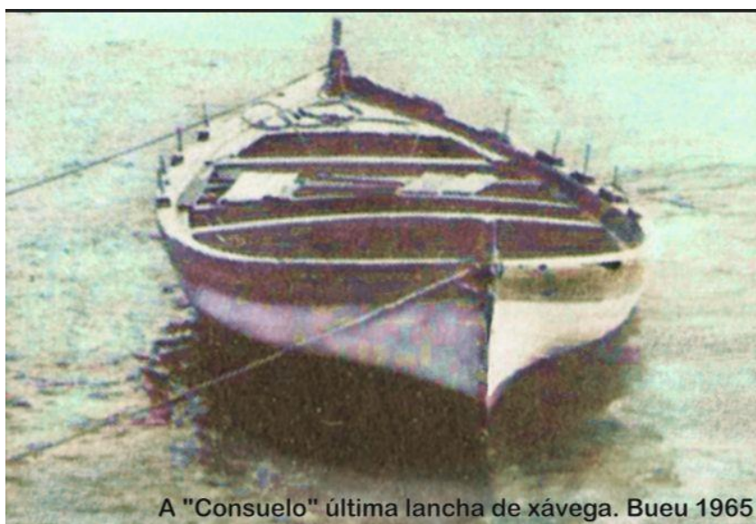
A "Consuelo" última lanha de xávega. Bueu 1965