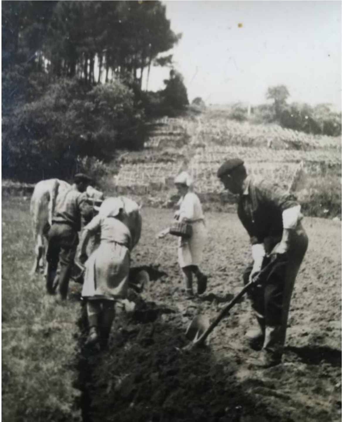
Veciños de Donón na labranza nos anos 60.

Decidimos, pois, poñer dúas estampas de Donón da década dos 60 e ámbalas dúas con presenza da tracción animal que tanto axudou aos nosos antepasados a sementar os campos. Moitos destas leiras pertenceron á aldea ou Casal de Barra que quedou asolagada pola area alá polo s.XVI.