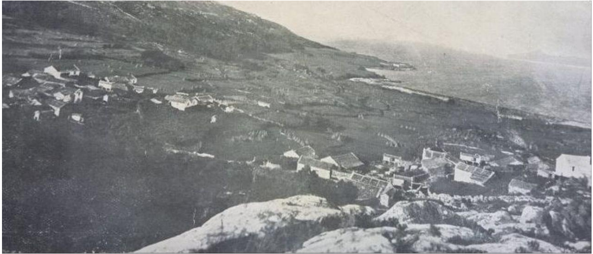
Unha vista da aldea de Vilanova en 1931, coa ría ao fondo.