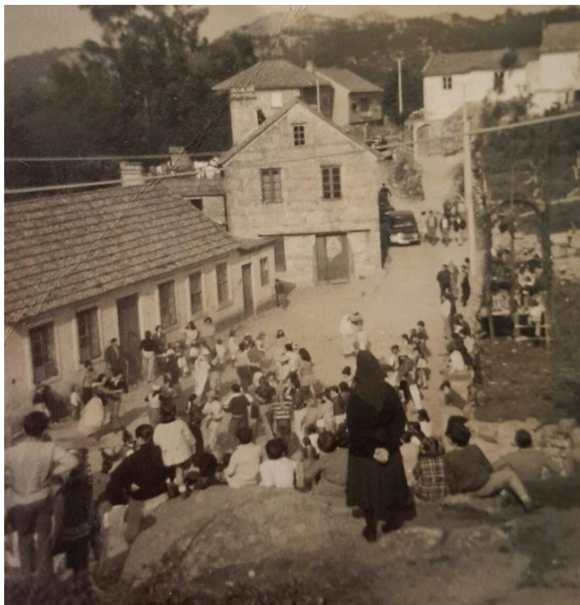
O entroido no Xogho da Bola, en Nerga. |

Para Nerga escollemos dúas instantáneas. Unha relacionada coa celebración do entroido onde se aprecian vivendas e o palco onde tocaban os gaiteiros no Xogho da Bola.