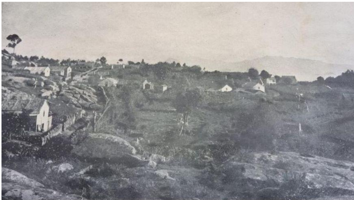
A aldea de Nerga no ano 1931. | // S.S.M. A UNIÓN

A outra consta dunha vista de Nerga en 1931, do libro da “Sociedade de Socorros Mútuos A Unión”.