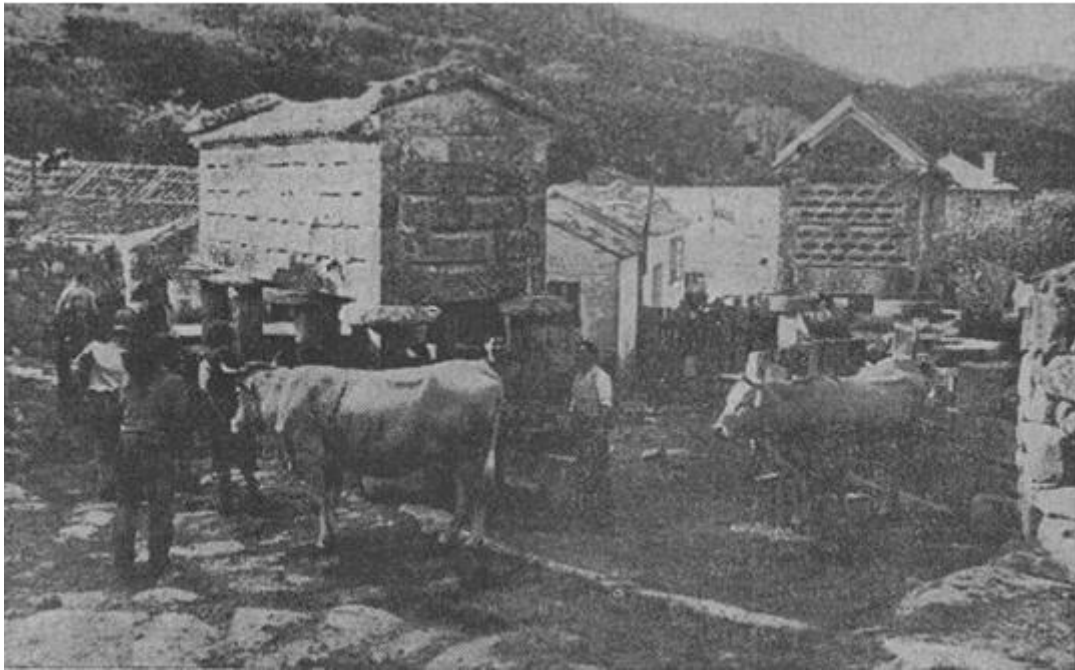
A aldea de Donón en maio de 1962.