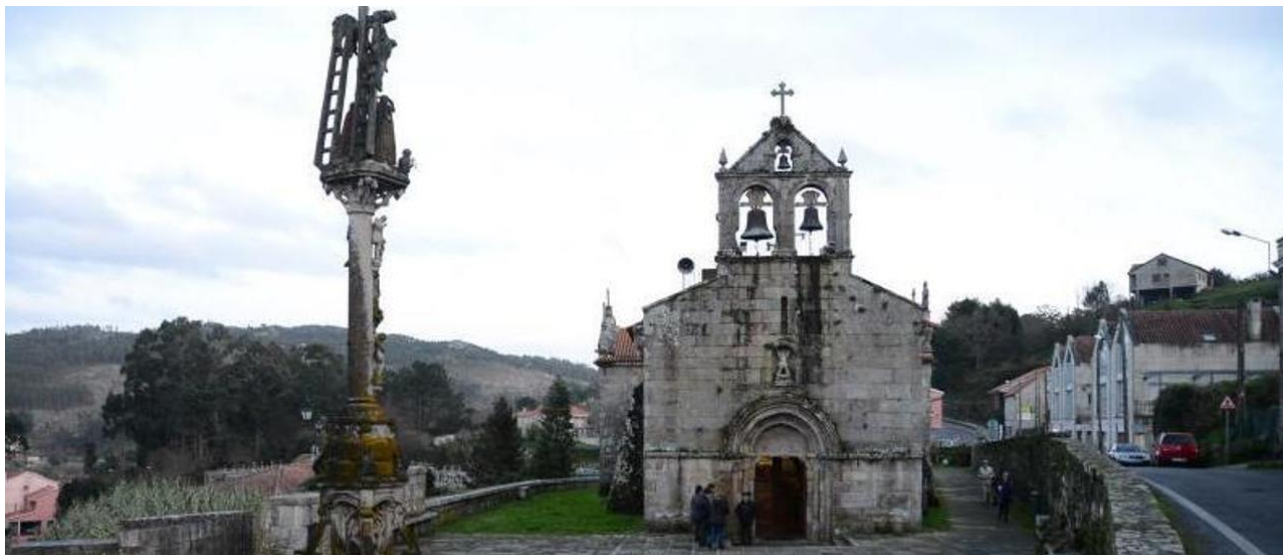
Unha vista da igrexa do Hío e do seu emblemático cruceiro.

A mediados do século XVIII, segundo o Catastro de Ensenada, había na parroquia canguesa unha quincena de canteiros