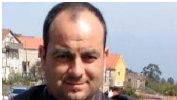
*Veciño do Hío