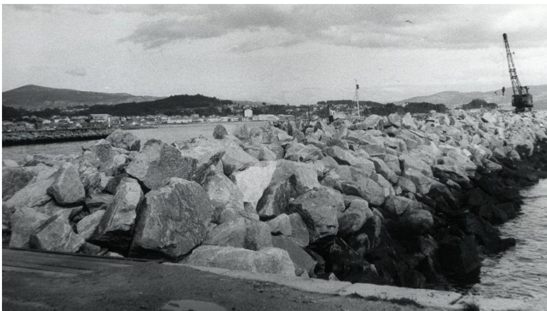
Cangas 1972. Construción do dique de abrigo.

en xeral (acompañado de numerosas sinaturas), foron remitidas ó Ministerio de Obras Públicas, sección portos.