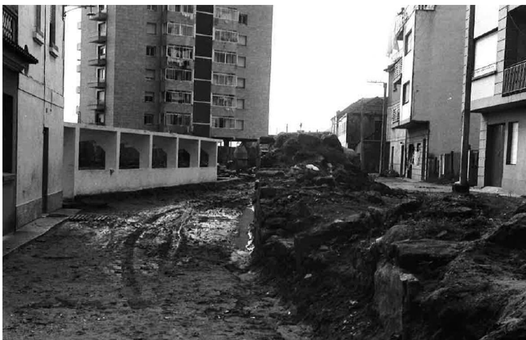
Lavadoiro público do río Bouzós, que desapareceu para levantar un edificio no seu lugar. Traballos para acondicionar a futura Rúa Noria

Que podemos dicir das Pontes? Outro tanto do mesmo, a destrución foi total. Soterráronse as dúas pontes, e mesmo o último tramo do río. Pouco máis arriba, permitiuse obrar sobre o mesmo leito do río, nunha parcela de propiedade municipal onde existía un lavadoiro. Todo aquilo fíxose sen que ninguén asumira responsabilidades. Non hai moitos anos houbo un par de intentos de descubrir o último tramo do Bouzós por parte do Concello, dende o emprazamento actual do cruceiro deixando á vista as dúas pontes ata o mar, pero, atopáronse coa firme oposición dun notorio grupo de veciños do Forte , alegando que a invasión de roedores sería unha constante. Ben puideron esixir o saneamento ao mesmo tempo de abrir o canle e permitir que o proxecto redactado fose unha realidade, ademais de librámos de algún que outro asolagamento. Que hai necesidade de aparcamentos? Claro que esa necesidade existe, e seguirá existindo. Pero de momento esa necesidade é un tema tabú, do que ninguén fala, como se non existirá esa necesidade. A que agardan as administracións para atopar unha solución definitiva acorde co problema que se nos vén enriba?