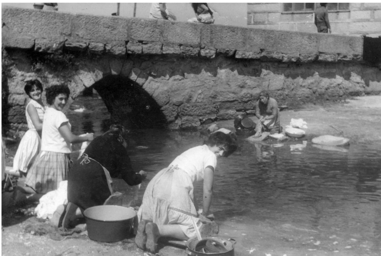
Unha imaxe do río Bouzós cara o ano 1965.

Na Ribeira acumulábanse desperdicios de todo tipo, restos de pinturas, sobrantes de peixes da veciña praza de abastos, cunha particularidade: a abundancia de raias de gran tamaño, ademais de restos de reparacións efectuadas nos numerosos barcos que alí poñían a súa barriga ó sol para seren reparados e “maquillados” . Outro dos residuos que destacaban era a gran cantidade de osos de vaca que aparecían no areeiro, e moi especialmente de “escápulas” (oso de forma triangular) que os rapaces aproveitábamos, dada a súa forma, para padexar e xogar coa area.