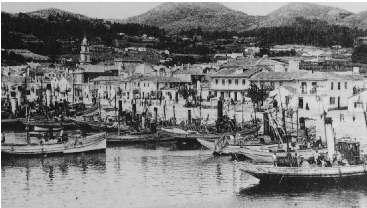
Cangas, principios dos anos 30. Imaxe da ribeira do Señal. / Arquivo do autor

O investigador cangués lembra a partires das aventuras de neno na ribeira do Señal, as praias desaparecidas por mor dos recheos