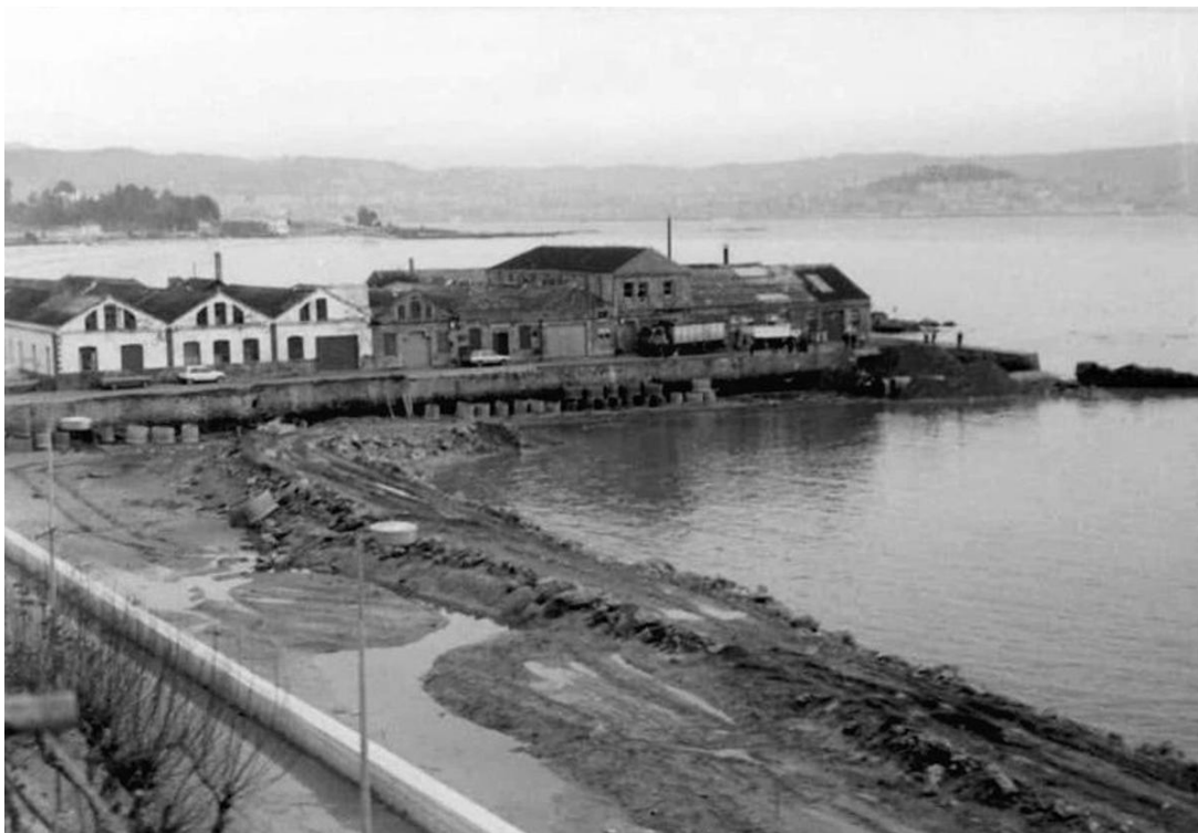
A natureza modificada no fronte de Cangas, no Señal.