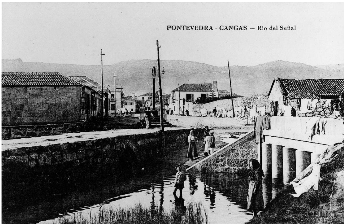
O río Bouzós en 1910. Tamén chamado o do Señal. As Pontes.