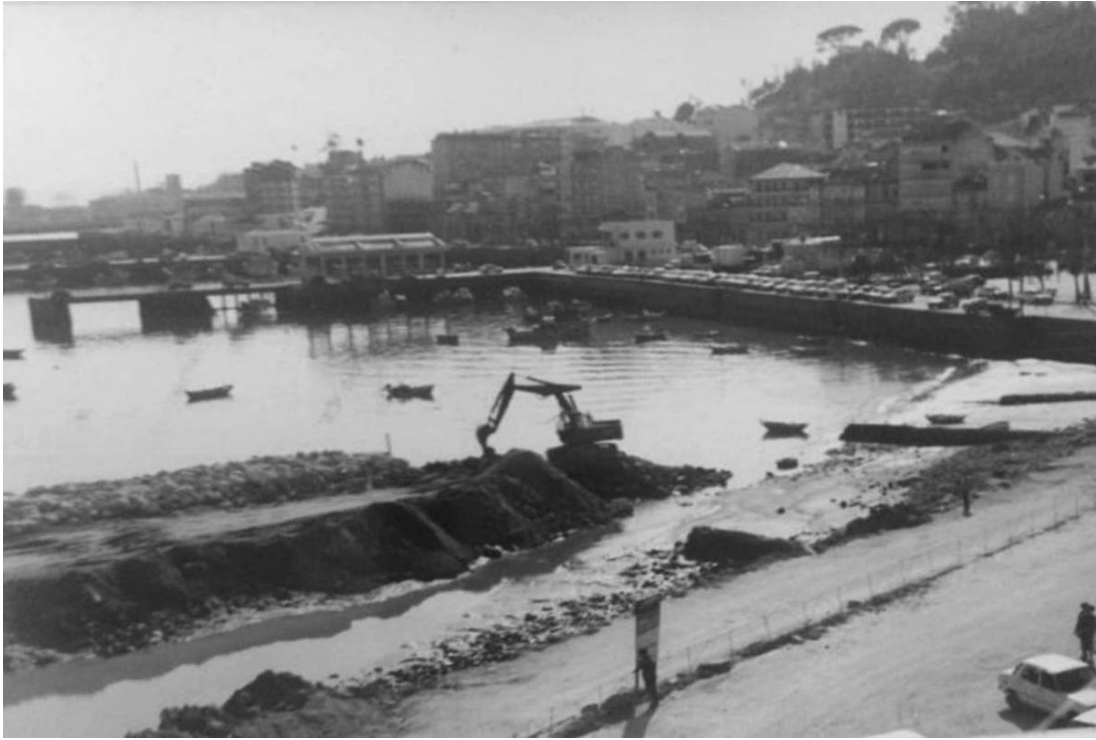
Outra imaxe do enterro da Ribeira na década de 1980.