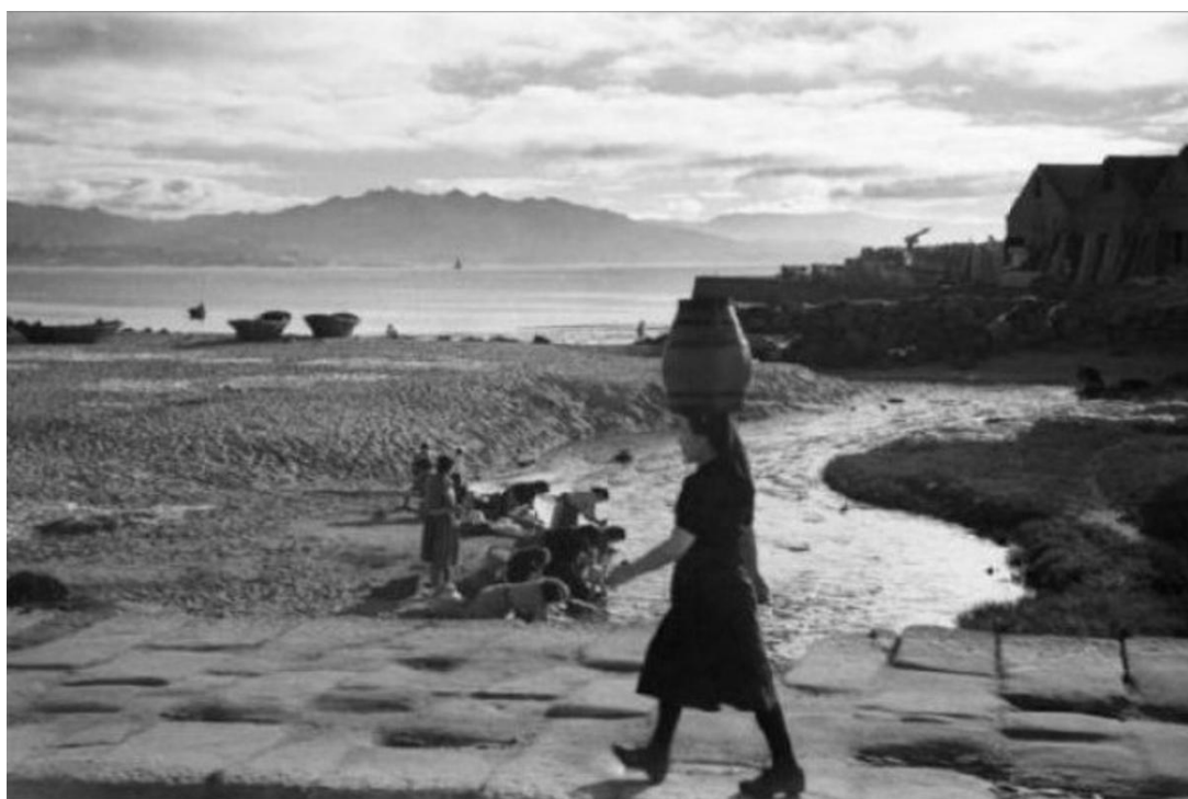
O entorno das Pontes, entre os anos 1946 e 1947.