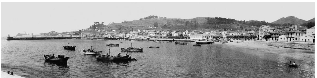
A praia do Señal nos anos 60.