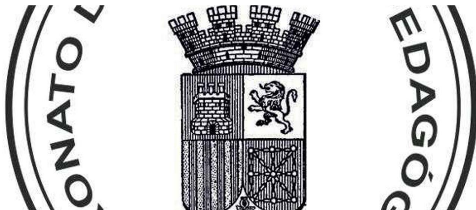
Carimbo ou selo das misións pedagóxicas.

O autor aborda o intenso labor educativo promovido durante a época da II República