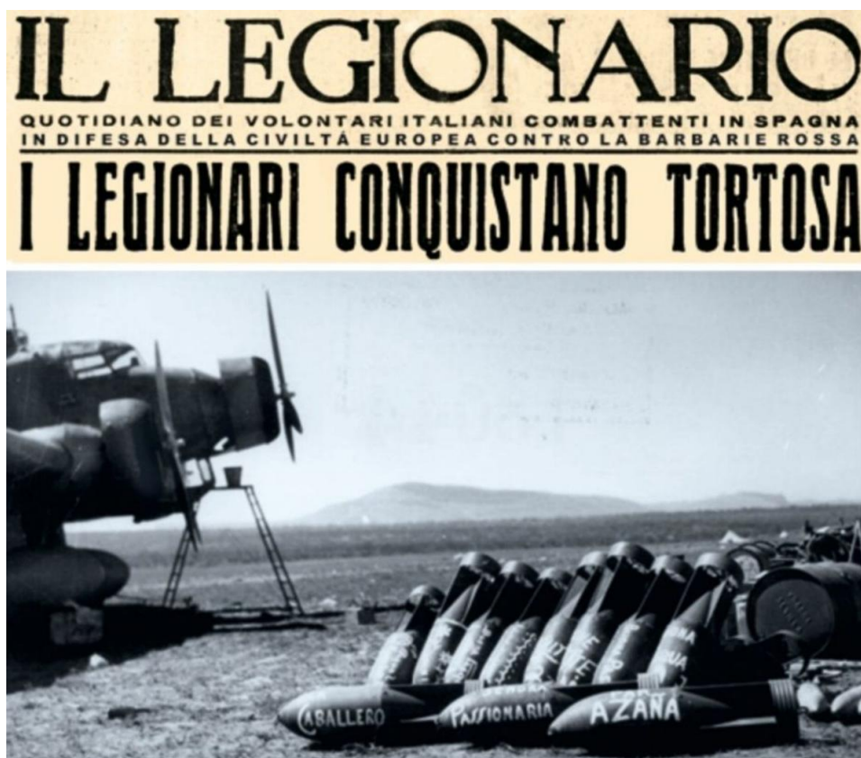
Bombas italianas con “dedicatorias” a líderes da II República, como Azaña, La Pasionaria ou Largo Caballero.

O ano 1943 vai ser aciago para os Paganini pois a Fiscalía de Taxas de Pontevedra vaille impor á fábrica do seu fillo Antonio Paganini Montemerlo unha multa de 20.000 pesetas pola venda de conservas a prezos abusivos con incautación de toda a mercadoría e o peche da fábrica por un ano. Descoñecemos a repercusión deste feito na familia pero a mediados de setembro de 1943 Guido Paganini vai presentar a súa dimisión como cónsul de Italia alegando que, fiel ao ideario do Fascio, el xa non se consideraba representante do mariscal Pietro Badoglio que mediante un golpe de estado o 25 de xullo deste ano, substituiría a Mussolini, sacando a Italia da guerra.