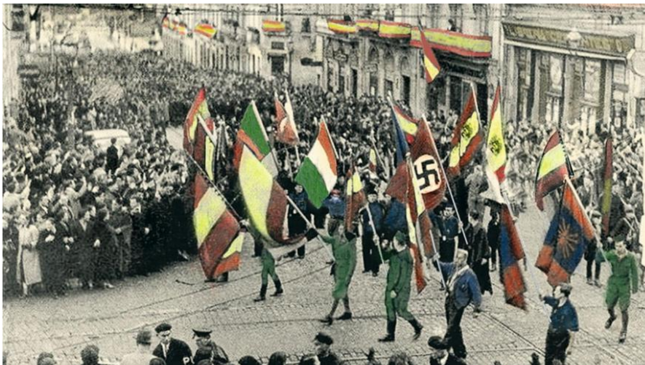
Acto de homenaxe a Alemaña, Italia e Portugal en Vigo o 19 de novembro de 1936.

O industrial deixou o consulado en 1943 e finou en 1951