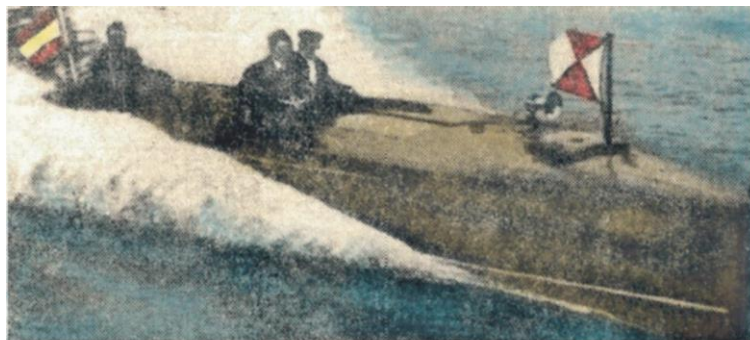
Paganini paseando pola ría a Marconi na súa canoa-automóvil en1928

cargamento de mármore e metais. A súa petición foi atendida e aprobada por disposición real o 9 de outubro de 1929, mais descoñecemos se sacou adiante este proxecto, pois estes asuntos levábanse con moito secreto para evitar os saqueos.