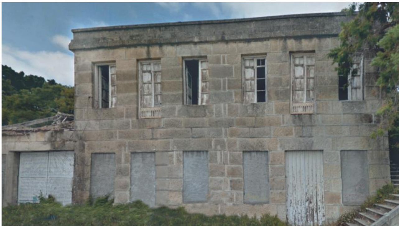
A casa vivenda da salgadeira de Paganini, único vestixio na actualidade.

O industrial conserveiro e cónsul logrou campo para o Alondras