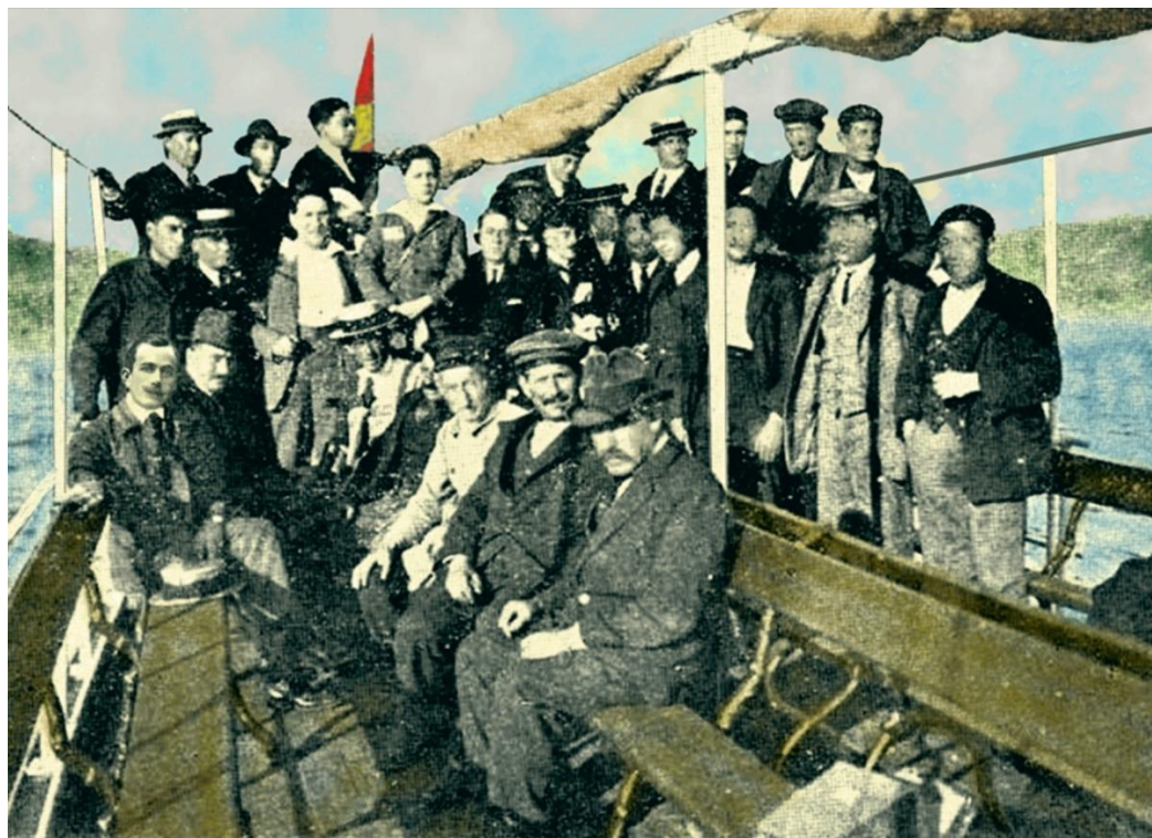
Paganini e Montemerlo con armadores e patróns probando o "Paradox" (un aparello para a limpeza das caldeiras) no vapor de pasaxe "María Luisa", en agosto de 1922. / Arquivo do autor

Os estatutos do "fascio" da revista Il Legionario. / Arquivo do autor