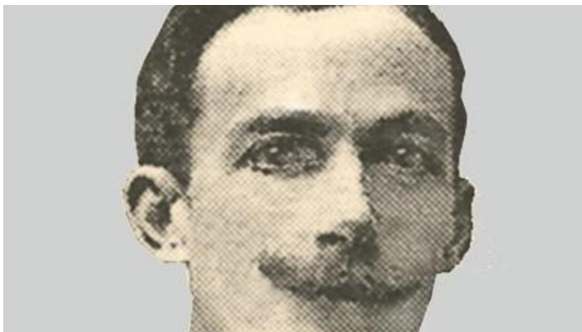
Un retrato de Guido Paganini Picasso.