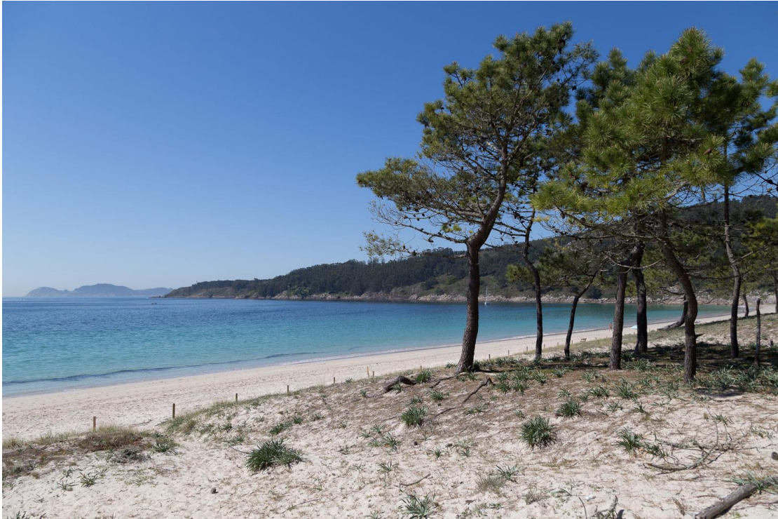
Praia de Barra

O que hoxe é un espazo dunar era séculos atrás un terreo cultivable, cheo de leiras produtivas. O estudo centrouse particularmente na documentación referida aos séculos XVI e XVII, un período no que en varios momentos aparece a preocupación polos "problemas causados pola area", coa redución do terreo cultivable e a menor produción das colleitas neste lugar que cada vez máis se ía enchendo da area que introducían os fortes temporais e as enchentes do mar.