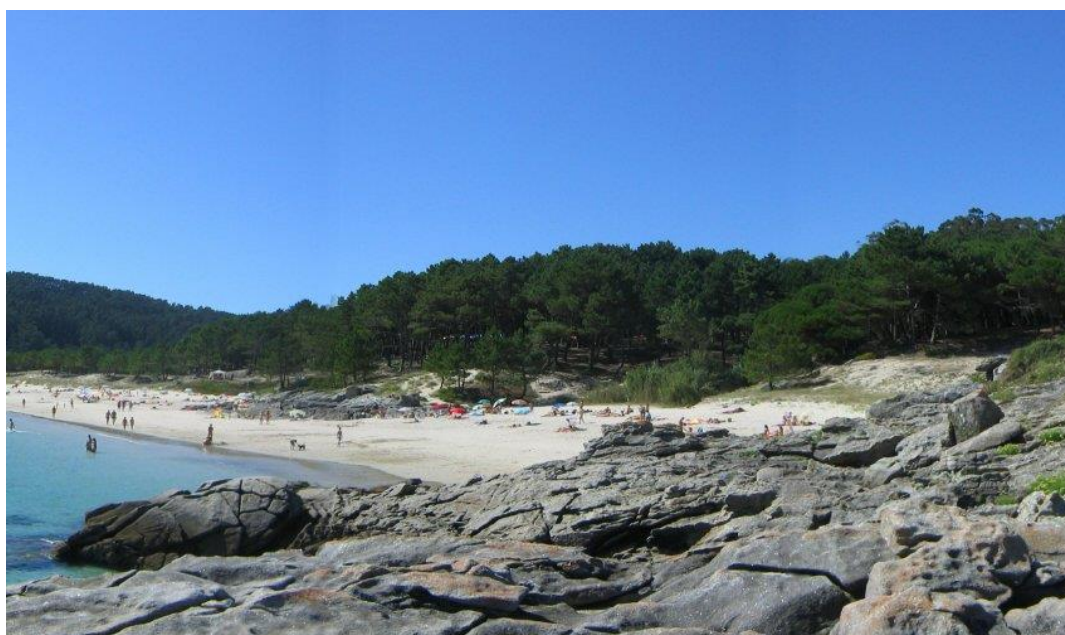
Vista xeral da praia de Barra, en Cangas

https://praza.gal/ciencia-e-tecnoloxia/a-aldea-de-cangas-que-desapareceu-hai-400-anos-baixo-a-area-por-mor-dun-cambio-climatico?fbclid=IwAR179ankgPp84Wqds4KPP_Qv9oLLKNBX9eI_QwBG9c6qrt1lxL7BugRp-xU