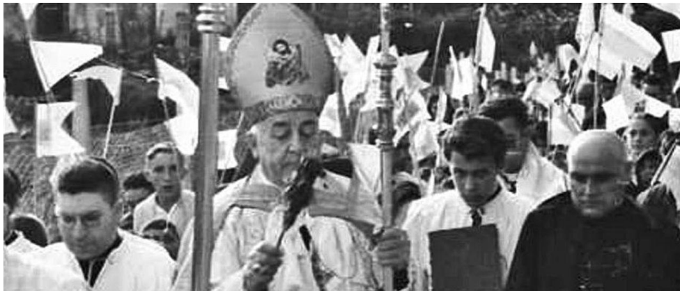
Bendición da igrexa do Carme.

O 21 de setembro cumprense seis décadas da igrexa da Praia que deixou a histórica parroquia de San Martiño co 30% da poboación