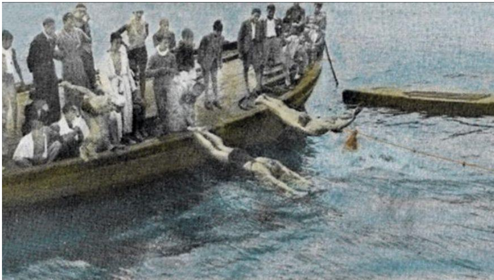
Competición de natación Rodeiramar - Náutico de Vigo en 1932.