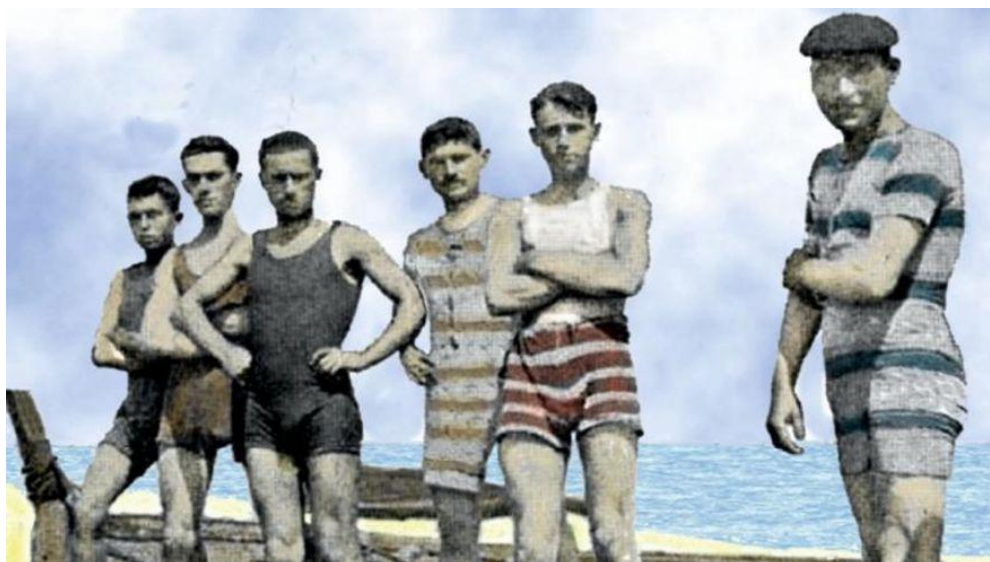
Equipo de waterpolo Rodeiramar en 1931.

A natación, pola súa escasa complicación, agás os pudorosos “traxes de baño completos” esixidos, é un dos deportes máis antigos e xa estivo presente nos Xogos Olímpicos de Atenas en 1896. Porén non sería ata os anos vinte que as competicións non contasen cunhas bases e estilos diferenciados. Nas festas que se celebraban nos meses de verán como o Carmen ou o Cristo, adoitábase incluír competicións de botes, gamelas ou traíñeiras e arredor dos anos vinte tamén se prodigan as probas de natación, aínda que con poucos participantes.