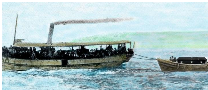
Recreación del vapor Marcelino Barreras y la lancha con el féretro

Tamén, antes de comezar a autopsia, realizaron un novo rexistro das roupas , atopando varias cartas e a súa cédula (carné desta época) que indicaba que tiña 34 anos pero segundo os seus coñecidos botábanlle corenta e pico. O ditame final da autopsia concluiu que practicamente non inxerira alimentos nas últimas horas e que o falecemento foi debido a unha conmoción cerebral , sen especificar a causa e que quizáis por culpa da mesma caeu ao mar, afogando ao ser arrastrado polas correntes.