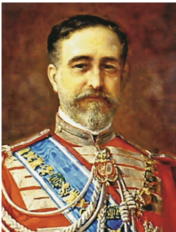
Marqués de Aranda.