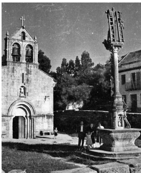
Igrexa e Cruceiro do Hío entre 1954 e 1964.

Ante o crego de Darbo don Jose B. Mallo e o "individuo de Ayuntamiento" (sic) don Juan Manuel Matos Benavides, faise o inventario que se refire á dita igrexa. Inventariándose no interior do templo de Darbo o seguinte: /...La Cruz Parroquial de Plata, dos calices de idem con sus respectivas Patenas, un Copon de idem qe se halla en el sagrario, un Relicario para llevar el Biático á los enfermos, Las tres oleeras tambien de lo mismo, un incensario con su naveta y una Lámpara tambien de Plata qe alumbra al Santísimo, qe son las unicas qe hemos encontrado... se hallan fundadas en la misma Yglesia hasta tres Cofradías con diferentes advocaciones, como no posehen Rtas (rentas) algunas y solo se conservan á devocion de los mismos fieles y con las mismas Limosnas con qe contribuien en las especies de maíz, Lino y vino al tpo. (tiempo) de las cosechas.../