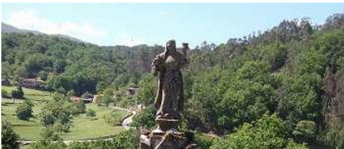
Panteón en Cerdedo.

O autor achega unha investigación sobre a traxectoria do probable autor do Cruceiro do Hío