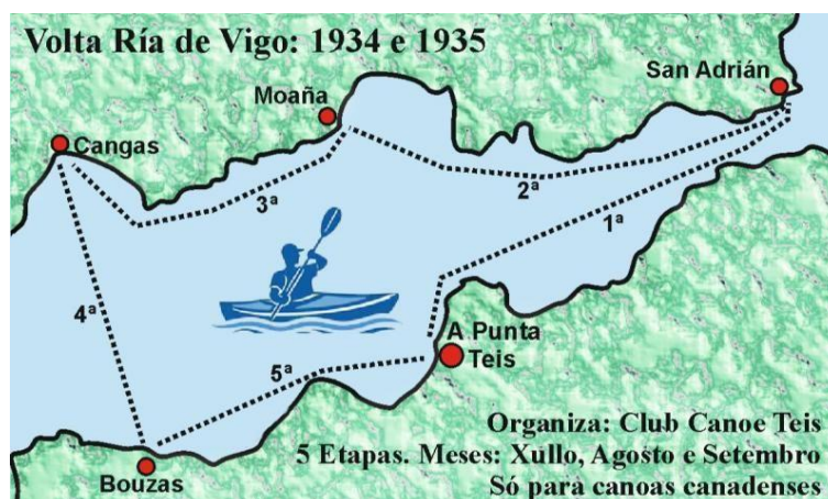
Mapa da Volta Ría de Vigo, nos anos 1934 e 1935.