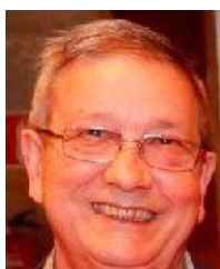
*Profesor e investigador