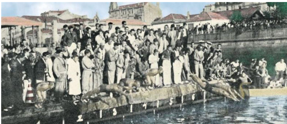
Competición de natación na dársena de Vigo.