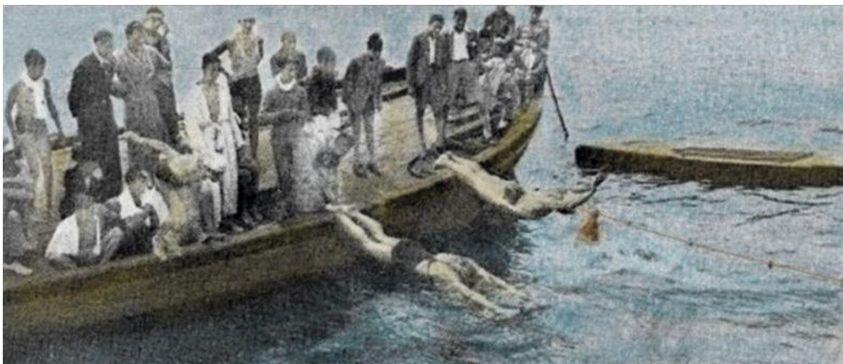
Competición de natación Rodeiramar - Náutico de Vigo en 1932.