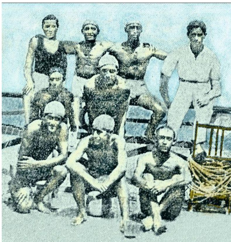
Equipo de waterpolo Rodeiramar en 1931.