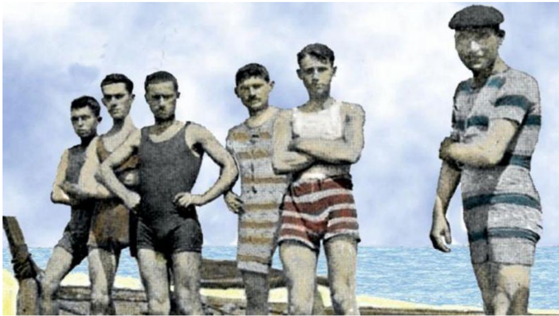
Concurso de natación en Bueu en 1920.

Unha proba de natación que alcanzaría grande interese foi a Travesía da Ría , denominada Concurso Internacional de Natación pois asisten nadadores portugueses e que comeza a celebrarse en agosto de 1929, alcanzando varias edicións que a converteron en tradicional.