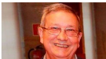
*Profesor e investigador