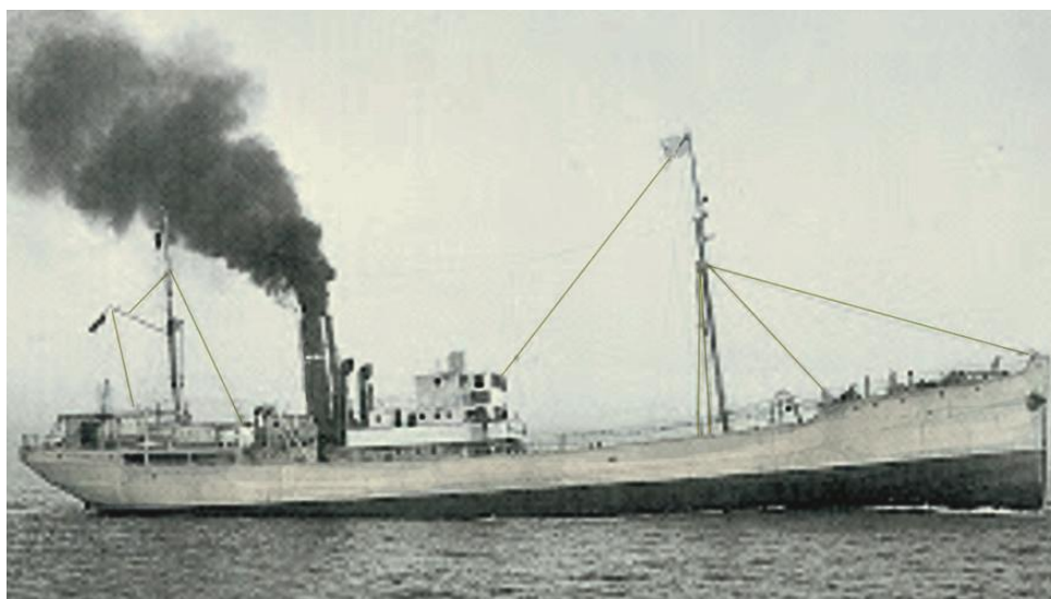
O barco "Puerto de Navacerrada" da empresa COPIBA, ano 1948.

Desde 1977 todo foron dificultades para esta pesca . Primeiro pola redución por sobrepesca, logo pola veda e peche do caladoiro para a flota española e finalmente pola coñecida “guerra do fletán”, que causou conflitos diplomáticos con Canadá. Ata hai uns anos eran dúas as asociacións, unha galega ( Agarba de Vigo ) conformada polas empresas Áncora e Velaspex , e outra vasca ( Arbac de Pasaia ) as que pescaban bacallao no Mar de Barents no Ártico ruso-escandinavo . A empresa vasca traballaba cunha parella de barcos e a sociedade galega con tres barcos, dous e un de cada empresa que na actualidade xa se reduciron a dous. Entre ambas xestionaban o 65% dos dereitos españois desta pesca , destinada en gran parte á exportación, vendo incrementado o seu beneficio nun 15% polo abaratamento do combustible e o aumento do prezo do bacallao.