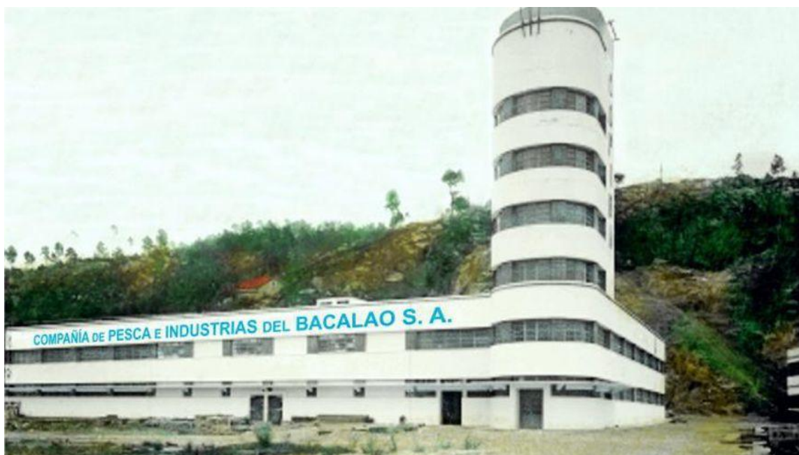
A sede da Compañía de Pesca e Industrias del Bacalao S.A. (Copiba), en Redondela.

Nos anos sesenta destacaríase a empresa Alvamar que a pesar de ser vasca, constrúe grandes barcos en Barreras e que tamén levaban nomes como “ Ponte de Rande ”, “ Estreito de Rande ”, “ Rodeira ”, “ Xaxán ”, “ Meixueiro ”, “ Monte Confurco ”, “ Monte Galiñeiro ”... Todos con tripulacións galegas nunha alta porcentaxe. Desde 1952, mentres os portugueses seguían coa pesca de vela e anzó, van ser máis as parellas galegas no banco de Banquero pola falta de capturas no mar de Irlanda. Nestas datas, os portos de Ribeira, Coruña e Vigo eran os principais na descarga do bacallao despois de tres meses de faena.