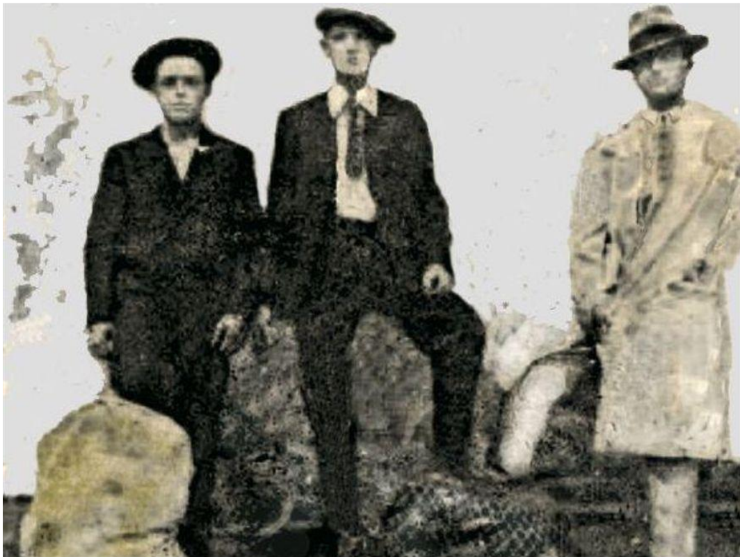
Mariñeiros galegos en Pasaia, ano 1922.

No ano 1938, en plena guerra civil, nacería en Salamanca unha nova empresa bacalloeira denominada PEBSA (Pesquerías del Bacalao S.A.), que tería como base das súas instalacións o porto da Coruña ao estar dirixida polo seu maior accionista, Pedro Barrié de la Maza e o Banco Pastor, que viñan sendo o mesmo . Barcos merluceiros como o "Rande" e "Rodeira", de indubidable fasquía e tripulación galegas, van operar en 1949 como parella na pesca do bacallao aos que logo se sumarían outras como "Arriscado"/"Cervello" ou "Esguío"/"Farfalleiro", que marcarían os tempos épicos dos galegos en Saint Pierre et Miquelon durante anos . Porén, en 1960 xa pasa por dificultades pola caída dos prezos e acabaría pechando en 1992 a pesar de fusionarse desde 1971 con Agrupesca e outras empresas da mesma cidade, contando en 1988 con máis barcos que outras compañías.