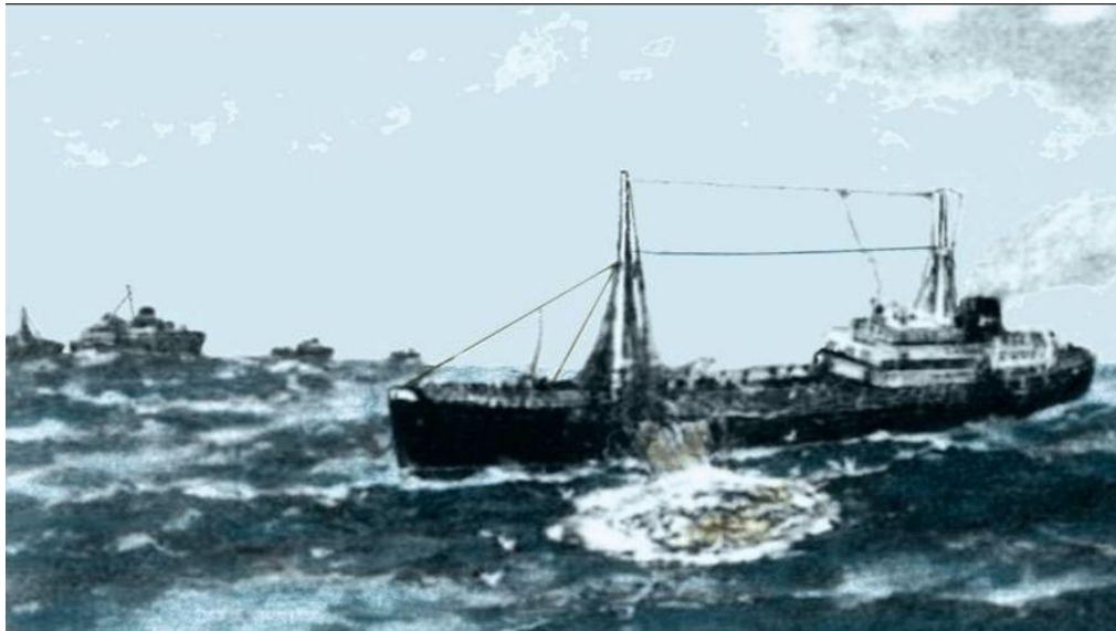
Un bacaloeiro da empresa Pesquerías y Secaderos de Bacalao de España (PYSBE) en 1927.

A empresa Casa MAR (Motopesqueiros de Altura Reunidos) fundada en 1939 tamén vai operar na zona de Terranova, Groenlandia e Boston desde 1950 a 1967 con barcos á parella como o “ Mar de Terranova ”/“ Mar de Groenlandia ”, “ Mar de la Rochella ”/ “ Mar de Irlanda ” ou o “ Mar de África ”/“ Mar de Sargazos ”. Ademais das duras condicións meteorolóxicas e do forte mar, estes barcos ao principio non contaban con radar nin sonda tendo que situarse e marcar o rumbo con sextante . Máis tarde, un dos barcos da parella xa levaba telefonía, entanto que o outro só contaba cun receptor, comunicándose cun código semellante ao Morse pero caseiro, pactado previamente .