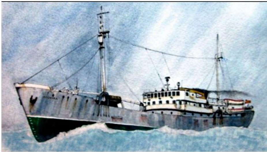
O bacalloeiro "Rodeira", da empresa Pesquerías del Bacalao S.A. (PEBSA)

No ano 1938, en plena guerra civil, nacería en Salamanca unha nova empresa bacalloeira denominada PEBSA (Pesquerías del Bacalao S.A.), que tería como base das súas instalacións o porto da Coruña ao estar dirixida polo seu maior accionista, Pedro Barrié de la Maza e o Banco Pastor, que viñan sendo o mesmo . Barcos merluceiros como o "Rande" e "Rodeira", de indubidable fasquía e tripulación galegas, van operar en 1949 como parella na pesca do bacallao aos que logo se sumarían outras como "Arriscado"/"Cervello" ou "Esguío"/"Farfalleiro", que marcarían os tempos épicos dos galegos en Saint Pierre et Miquelon durante anos . Porén, en 1960 xa pasa por dificultades pola caída dos prezos e acabaría pechando en 1992 a pesar de fusionarse desde 1971 con Agrupesca e outras empresas da mesma cidade, contando en 1988 con máis barcos que outras compañías.