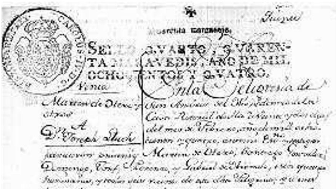
Venta dun terreo en Pinténs en 1804.

https://www.farodevigo.es/o-morrazo/2019/04/19/fabrica-ameixide-na-aldea-pintens-15715371.html