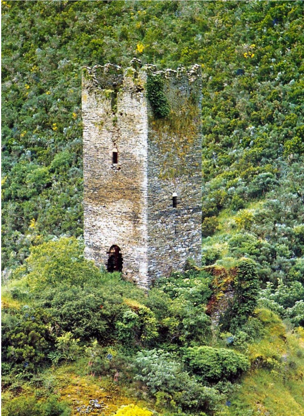
Torre de Doncos (As Nogais-Lugo) Algo semellante ao que sería a Torre de Meira.