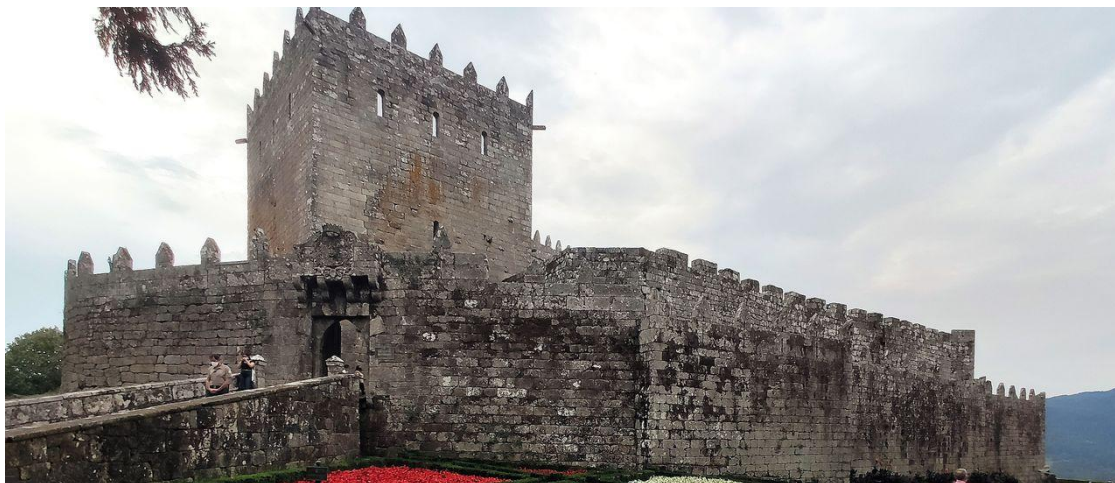
Castelo de Pedro Madruga en Soutomaior.

O investigador Xosé Carlos Villaverde fai referencia ó arbitraxe entre ambos arcebispos polos danos polas revoltas irmandiñas