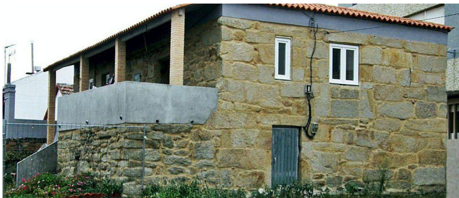
A coñecida como Casa dos Pobres, no entorno do colexio Compañía de María.

O autor afondará ao longo de varias entregas na evolución da sanidade no Morrazo