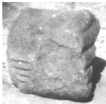
Resto dunha ara do castro de Monte Castelo