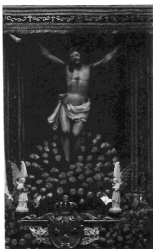
Cristo dos Navegantes ou da Agonía

Son estas dúas imaxes que se veneran na Vila de Redondela, o Cristo con día propio no luns seguinte á oitava da Pascua ao que se lle fai magna procesión, sobretudo polos mariñeiros de Cesantes que lle renden grande devoción. Mais, este Cristo da Agonía, feito en 1754, ao igual que o que se festexa no Porriño, non conta co correspondente achado no mar como os que viñemos mencionando. Ademais disto e da devoción manifesta das xentes do mar a este Cristo, resulta que a confraría de pescadores da vila redondelá está encomendada desde moi antigo a San Xoan, advocación máis fluvial que marítima que conta con imaxe acompañando ao Cristo no seu retábulo pero que non recibe unha atención especial, igual que lle ocorre a Santiago O Maior que é o patrono parroquial. Con todo isto, cabe concluir no por que da exclusiva procesión do Cristo e que esta teña a súa razón votiva na maior concentración de xentes de mar no porto de Cesantes.