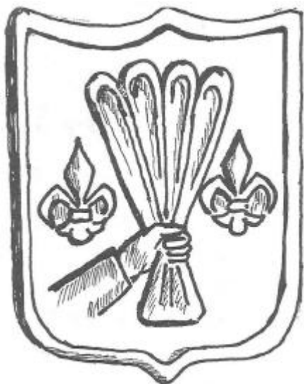
ESCUDO N.º 2