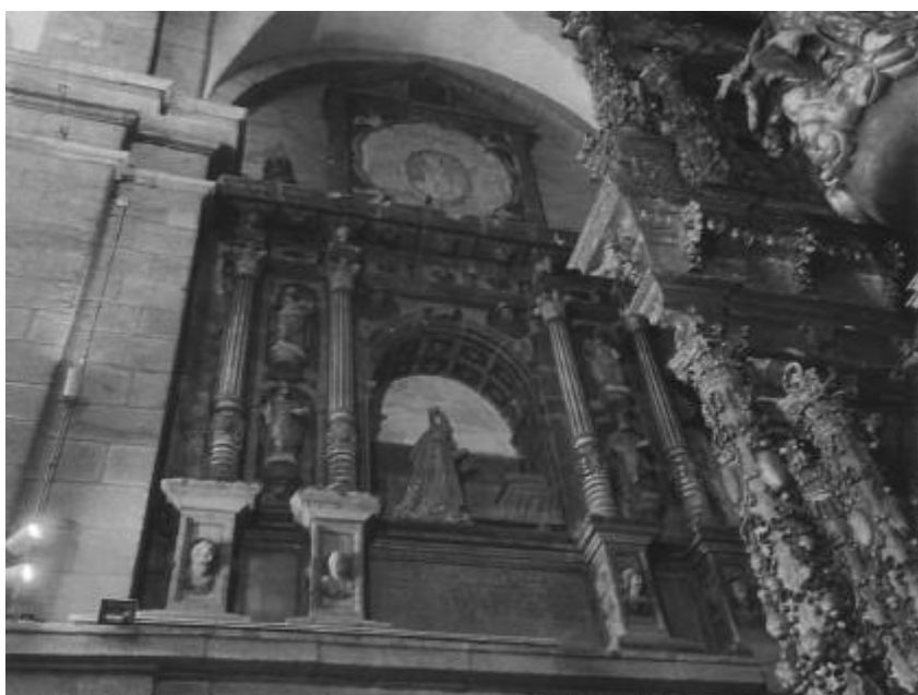
Santísimo Cristo do Consolo.

Desta capela podemos destacar que se atopa adosada á nave norte da igrexa, xusto ao lado da portada setentrional. A capela é rectangular e conta cunha ventá oxival no seu lado esquerdo. O seu arco formeiro é de medio punto, mais os arcos laterais de dentro da capela son apuntados, polo que conforma unha bóveda que mestura a de aresta coa de cruzaría. Ten 20 nervaduras que a conforman e as súas ligaduras nas claves ornáméntanse con 7 medallóns, seis deles refiren anxos, e a clave central o anagrama JHS.