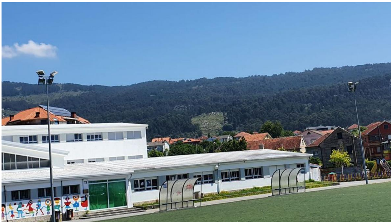
Estado actual centro educativo con el campo del keniatá.

Hoy, la comunidad educativa, vecinos y antiguos alumnos se reunirán y volverán medio siglo atrás para recordar esos inicios del gran colegio de Moaña, que en ciertos momentos llegó a albergar 1.400 alumnos -hoy tiene 400- y a tener que instalar casetas prefabricadas para albergar a todo el alumnado que no cabía en el edificio central, señala la actual directora Ainhoa Fuentes. Siempre fue un colegio con gran presencia en el engranaje social del municipio al contar en su claustro con activistas reconocidos como Manuel Méndez, entre otros: “Un aspecto a destacar es que muchas familias, de tres o cuatro generaciones siguen escogiendo nuestro colegio por el gran concepto que les quedó como estudiantes”. Y esa afinidad de generación en generación al colegio, hoy CEIP Plurilíngüe Reibón, se recoge en el spot de conmemoración que se ha elaborado y se presenta en los actos de hoy.