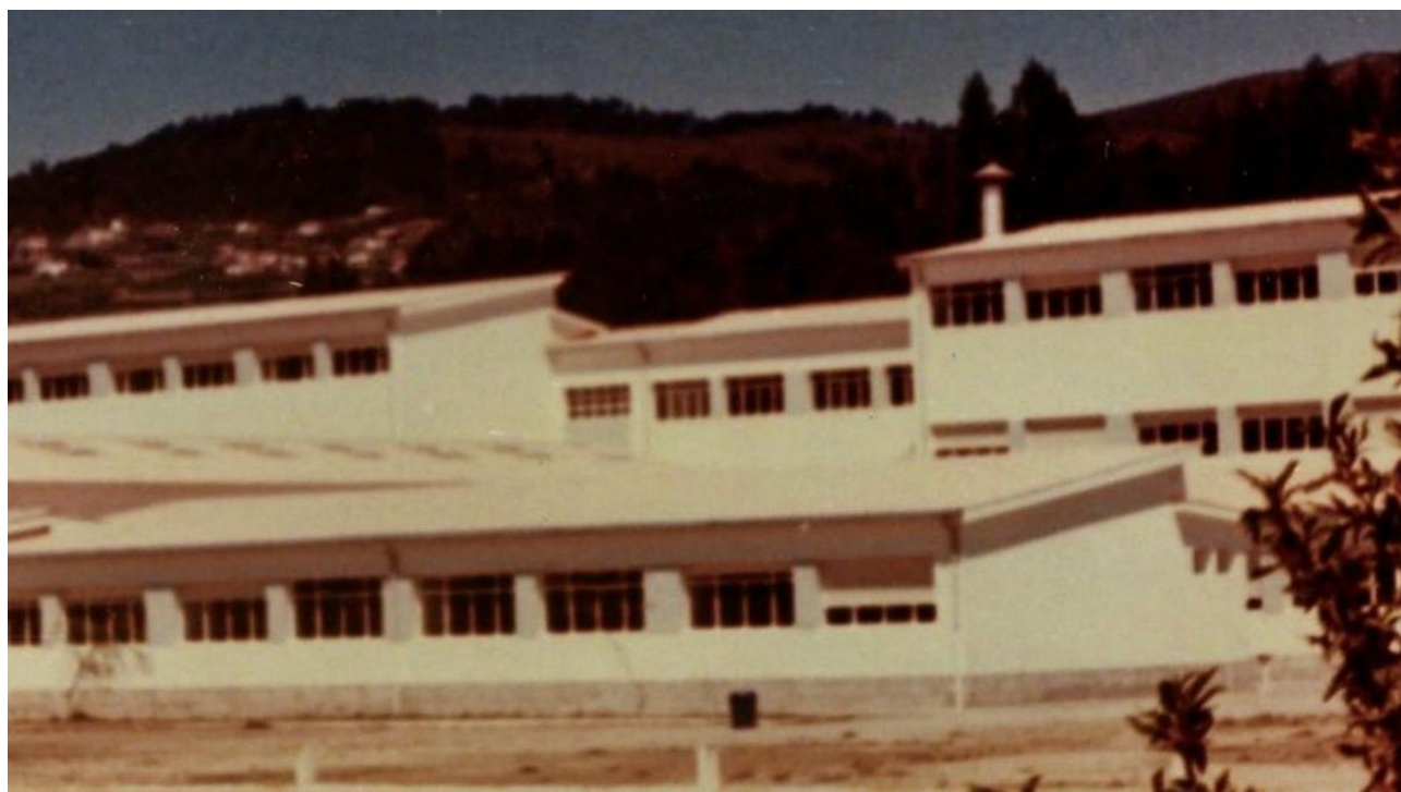
El colegio de Reibón en sus inicios.