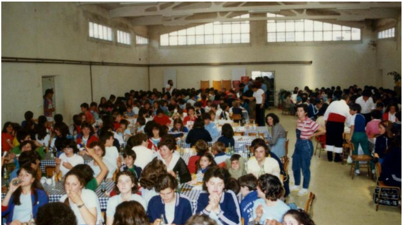
Imagen antigua del comedor escolar.

Pero hoy la comisión organizadora de los actos conmemorativos tiene programado en el salón de plenos del Concello, a las 13:00 horas, un acto en el que la corporación entregará un obsequio. El colegio presentará el spot y el himno, en un acto a lo que seguirá una comida de confraternidad de antiguos y actuales maestros de aquel Colegio Nacional, hoy CEIP Plurilingüe.