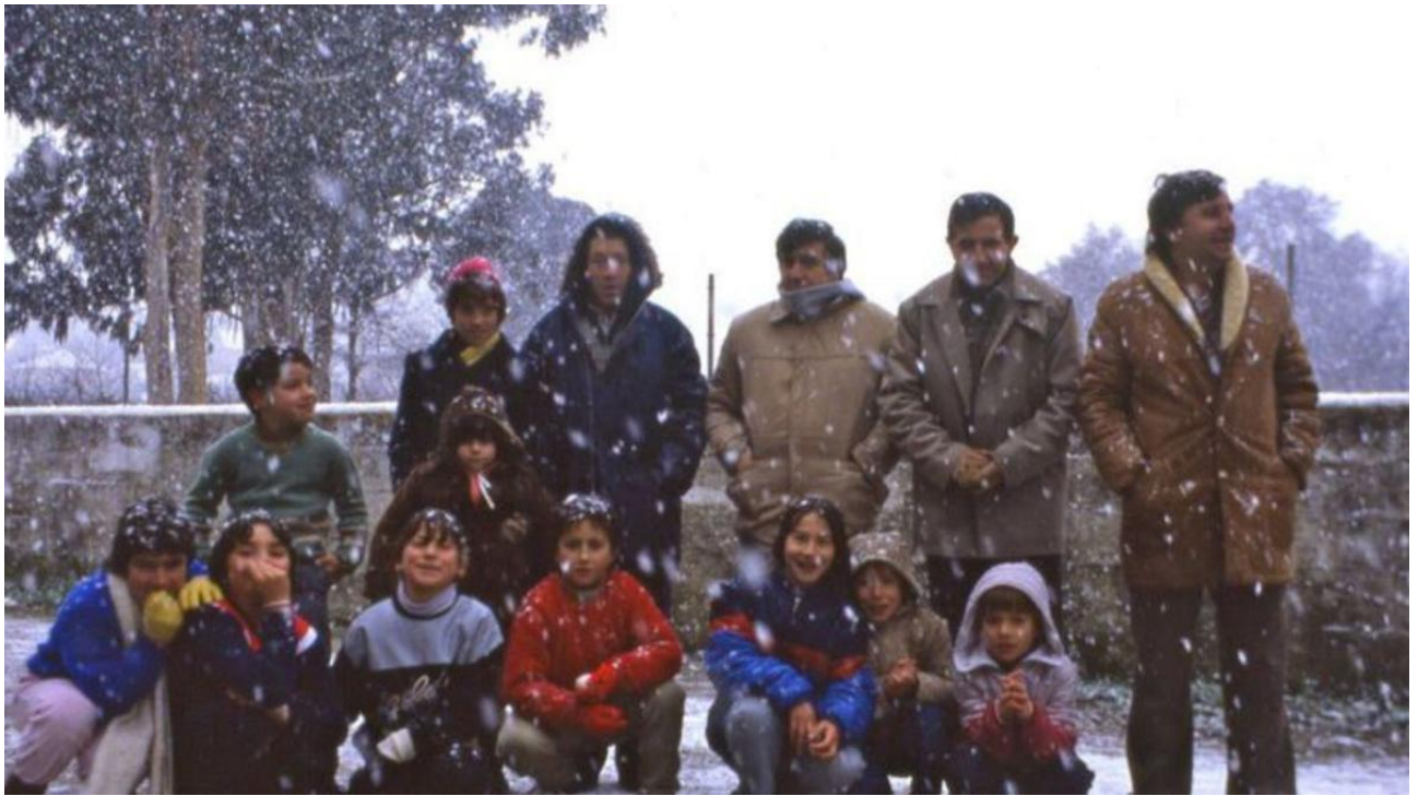
En el patio, un año de nevada.

Pero hoy la comisión organizadora de los actos conmemorativos tiene programado en el salón de plenos del Concello, a las 13:00 horas, un acto en el que la corporación entregará un obsequio. El colegio presentará el spot y el himno, en un acto a lo que seguirá una comida de confraternidad de antiguos y actuales maestros de aquel Colegio Nacional, hoy CEIP Plurilingüe.